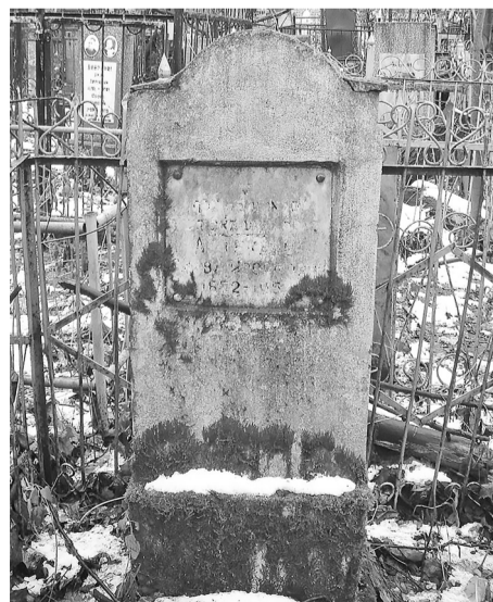
Заброшенных могил очень много, но чтобы в подобном состоянии находилось захоронение участника ВОВ, мы допустить не можем.