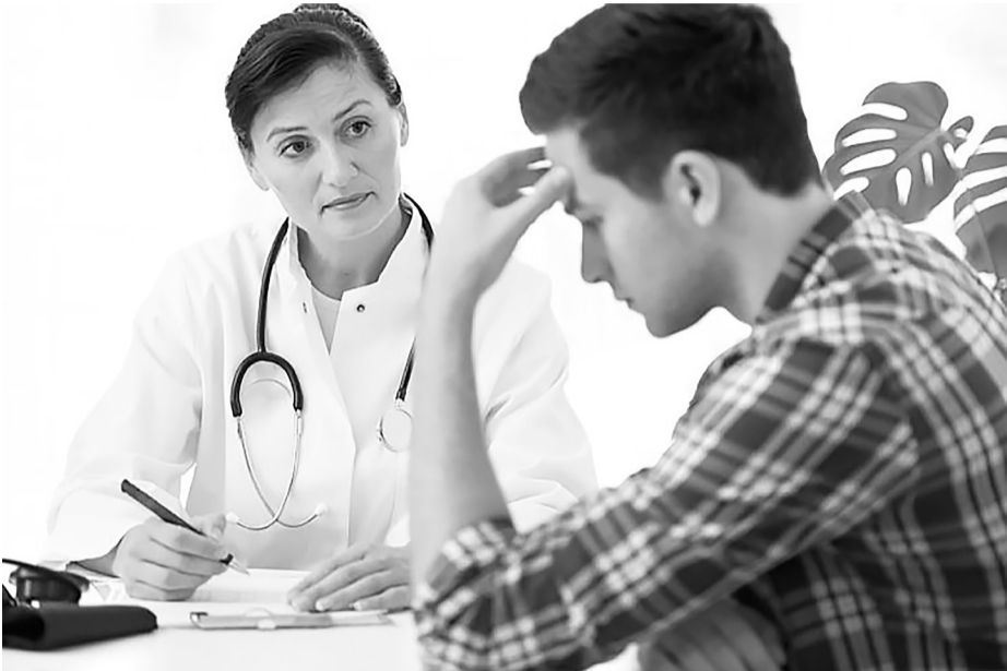
Сегодня заболеваниям, в том числе онкологиям, подвержены не только пожилые, но и молодые люди, поэтому диспансеризация особенно актуальна.

– Это можно сделать в Тюменских больницах по показаниям врача. Пройдя первый этап, пациент либо получает заключение, либо направляется на второй этап, и ему назначаются дополнительные исследования и консультации до подтверждения диагноза. В частности, если есть подозрение на рак лёгкого, пациента направляют бесплатно на компьютерную томографию лёгких в многопрофильный клинический медицинский центр «Медицинский город». Это уникальная возможность, поскольку всё делается по записи, обследуемому