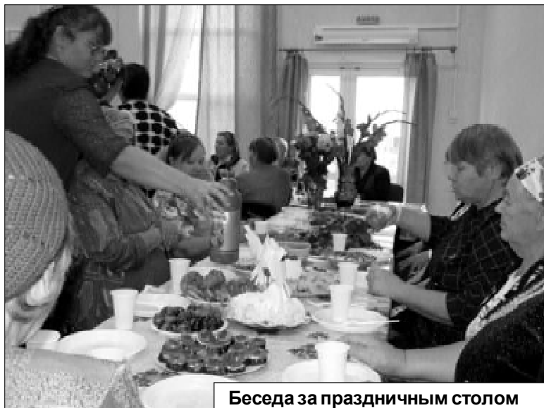
Беседа за праздничным столом