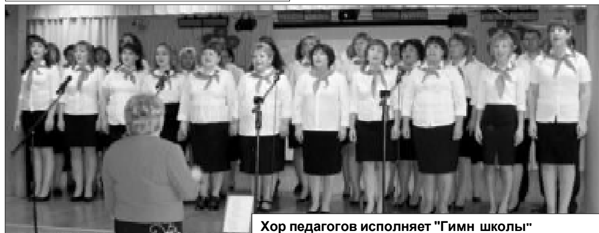
Хор педагогов исполняет "Гимн школы"