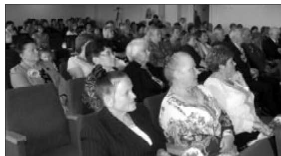
Гости юбилейного мероприятия