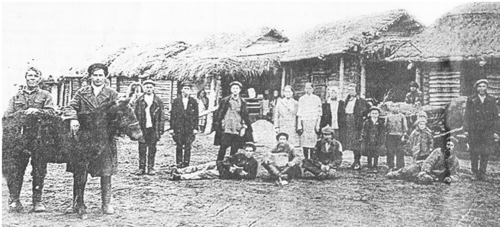
Колхозники боровлянского колхоза «Новая жизнь». Середина 30-х годов прошлого века