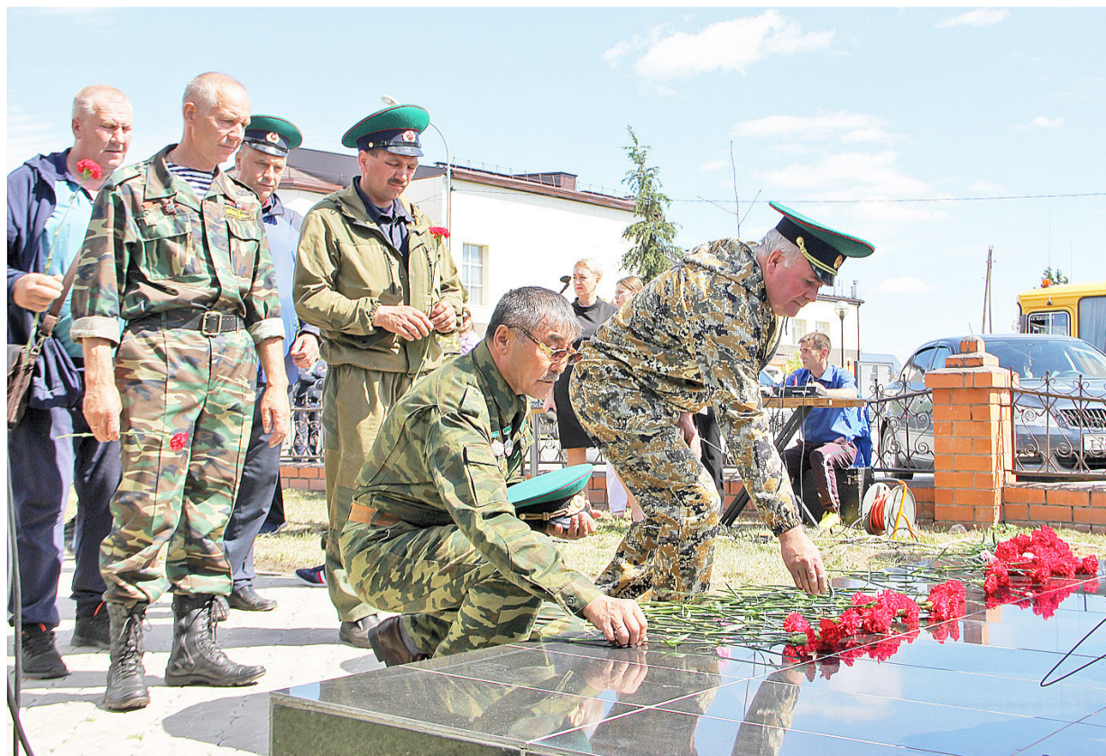
Самая важная традиция в День пограничника – это мероприятия в память о тех, кто погиб, защищая рубежи нашей Родины