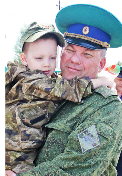
Во внуках ветераны видят себе достойную смену

Военнослужащие и ветераны пришли на мероприятие вместе с жёнами, детьми и друзьями. Все они радовались встрече, вспоминали