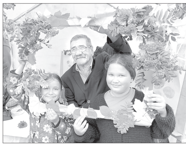
В Киёво фотографировались в осенней рамке не только поодиночке. Дедушка и внуки на портрете тоже отлично получились