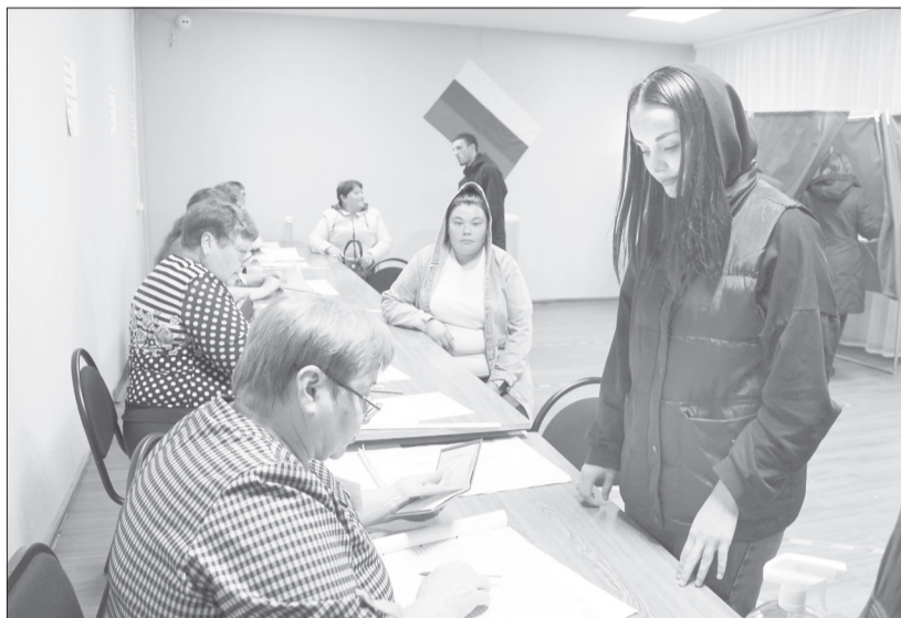
Бойко шло голосование в Киёво. Это самый многочисленный по количеству избирателей участок - по списку на момент открытия насчитывалось более 1270 человек

В Ялуторовском районе участие в голосовании на выборах губернатора Тюменской области приняли 87,2% избирателей. Это высокий показатель среди муниципалитетов региона.