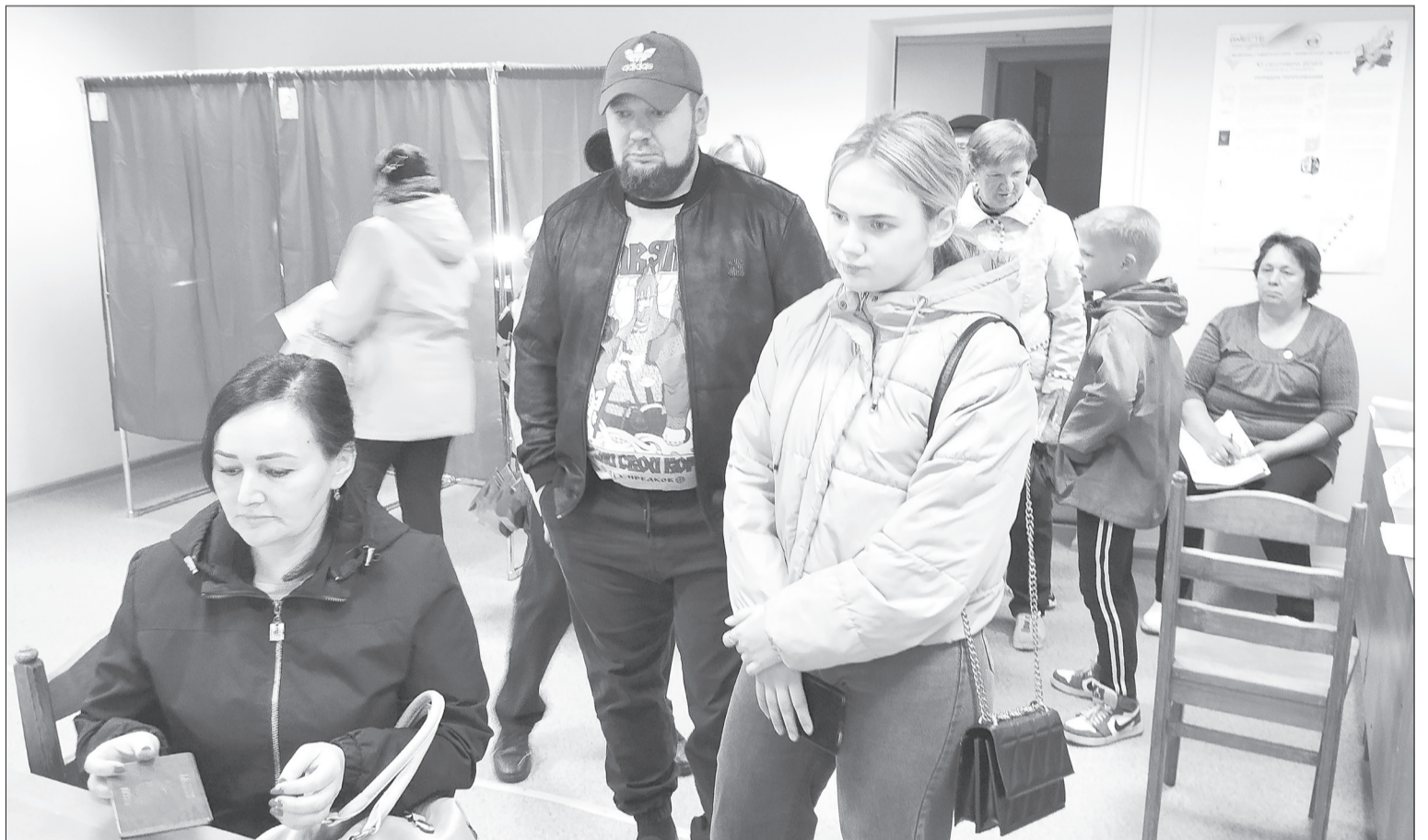
Очередь из жителей улицы Полевой выстроилась на избирательном участке № 2704

Адреса и явки. Второй интересный вопрос - это активность избирателей, то есть какой процент людей из числа внесённых в уточнённые списки приходит на участки. В Ялutorовске их