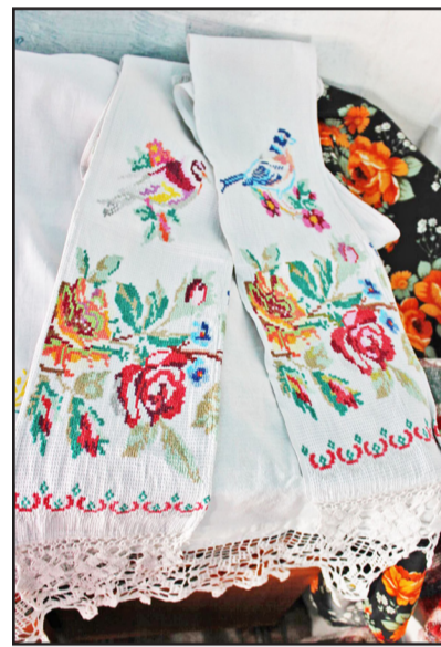
Этот расшитый райскими птицами рушник из самотканого полотна украшает одну из икон в нашем Никольском храме, придавая уют дому Божьему