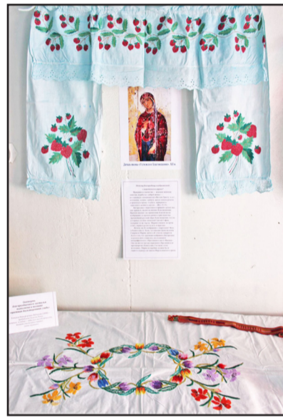
Облачение для красного угла и праздничная скатерть вышиты бабушками и прабабушками прихожан

бушкой Нати Вайзбек – эти талантливые рукодельницы всё свободное время посвящают самому женскому ремеслу». И даже так: «Нарядная блузка как солнечный женский привет из прошлого века сшита руками Сашеньки Пеленковой, скончавшейся совсем молоденькой. Её носила