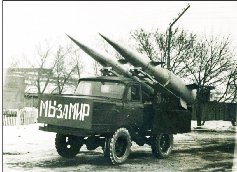
Одна из «самоходок», изготовленная умельцами «Сельхозтехники», которая демонстрировалась на празднике «Проводы русской зимы». 80-е годы

В связи с такими изобретениями было немало курьёзных случаев. Вот пример. Однажды наш работник сделал небольшой самоходный агрегат с использованием пу-