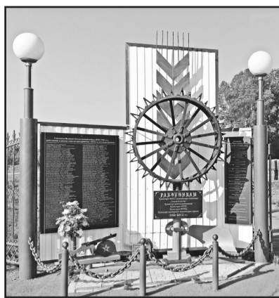
Символ воинской и трудовой славы работников Казанской МТС и «Сельхозтехники». Мемориал установлен при въезде на территорию МТС в 2015 году

В 80-е годы на общенародных праздниках «Проводы русской зимы» «Сельхозтехника» не раз демонстрировала самодельные машины. Посмотреть на эту необычную технику собиралась масса народу – и взрослые, и ребяташки. Причём можно было не только посмотреть на изделия рук человеческих, но и прокатиться на «самоходках», отчего ребяташки получали