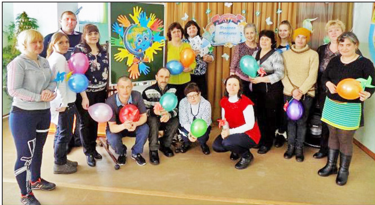
Родители школьников с удовольствием побывали на обучающих занятиях и мастер-классах

В последнюю субботу марта в Казанской общеобразовательной школе для детей с ограниченными возможностями здоровья состоялся форум «Большая перемена», на который были приглашены родители.