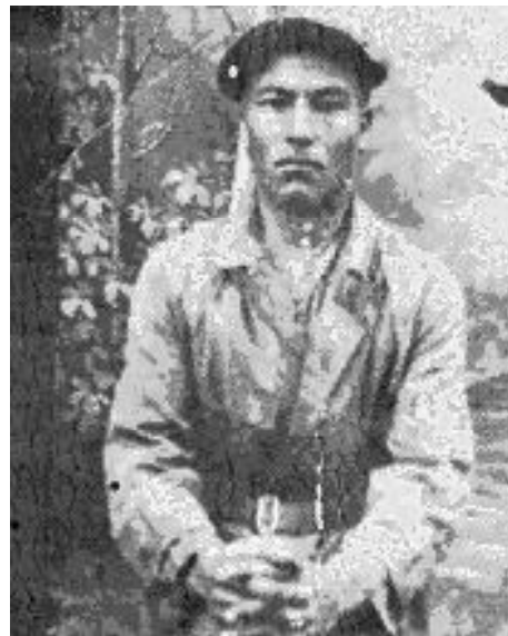
► Чулошников Пётр Алексеевич (1908 – 1942 гг.)

не получится, я твёрдо знаю, что имя моего брата не будет забыто, что в память о нём будут сказаны добрые слова, а в День Победы у мемориальной плиты с его фамилией будут лежать живые цветы.