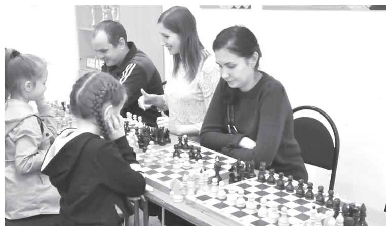
|| Родители вместе с детьми сыграли в шахматы.