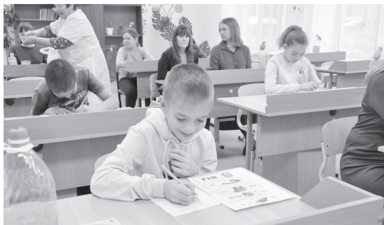
|| Шоу «Очумелой химички» собрало большое количество зрителей.