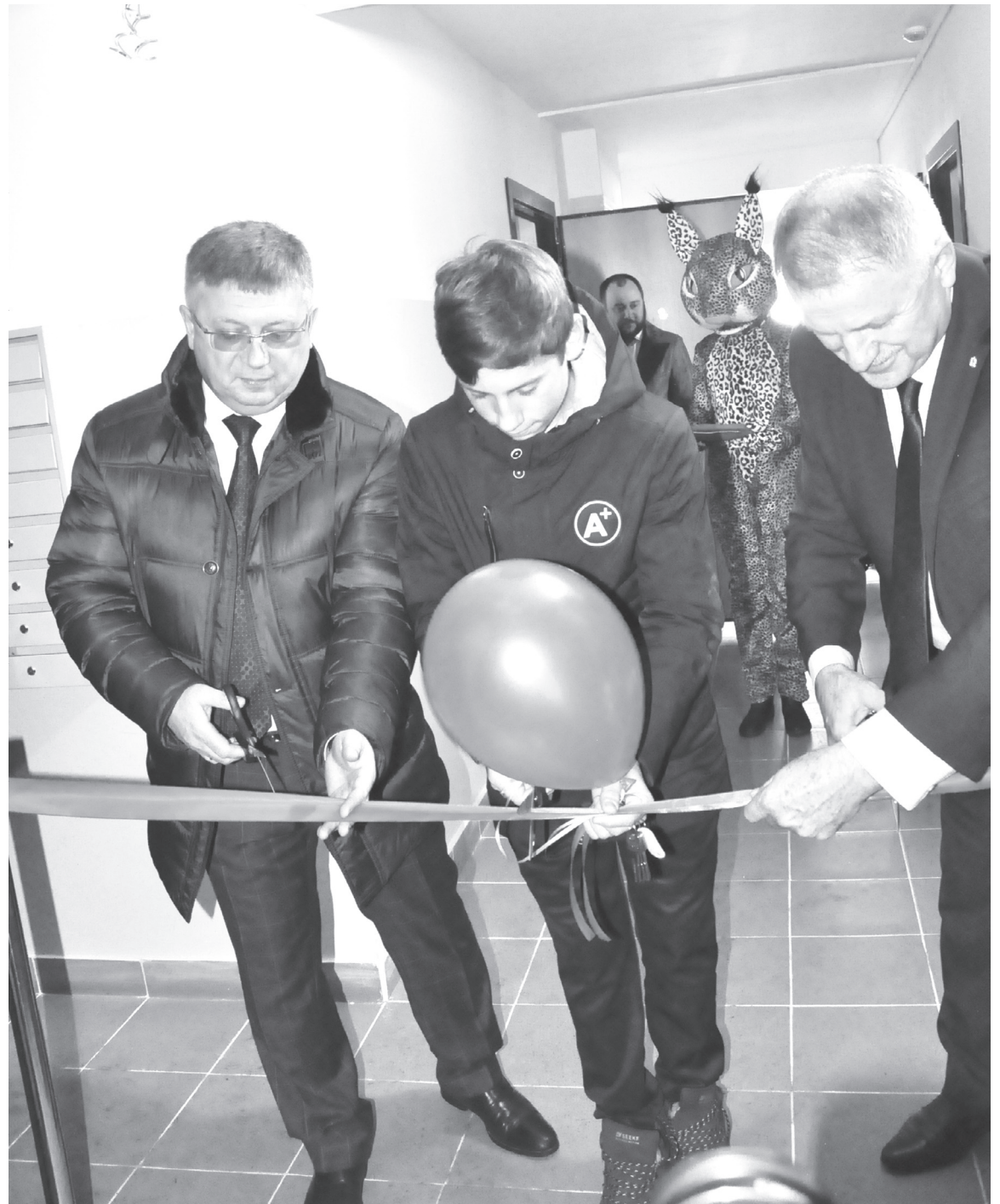
|| В честь открытия дома была перерезана традиционная красная лента.

ОТР входит в состав первого мультиплекса цифрового эфирного вещания. Региональный блок будет транслироваться дважды в день – с 6 до 9 часов утром и с 17 до 19 вечером. Врезки будут состоять из новостных и информационно-аналитических программ об общественной, культурной и политической жизни региона без возможности транслировать коммерческую рекламу. В Тюменской области подача в эфир телесигнала с изменёнными параметрами начнётся 15 ноября 2019 г. Следует отметить, что возможен сброс настроек на некоторых моделях цифровых телевизионных приставок. Если это произойдёт, то нужно будет запустить перенастройку телеканалов – автоматическую или вручную.