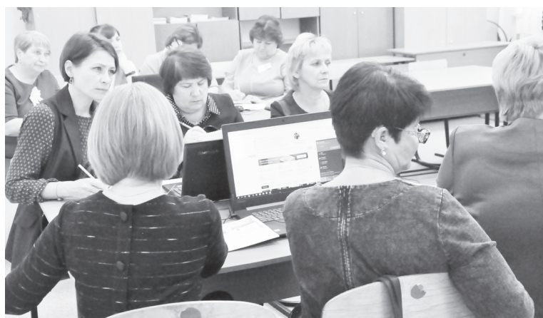
|| Педагоги на секции «Учитель будущего».

Для всех участников проводились динамические паузы. Можно было размяться в гимнастическом зале, сыграть в шахматы и посмотреть социальный видеоролик.