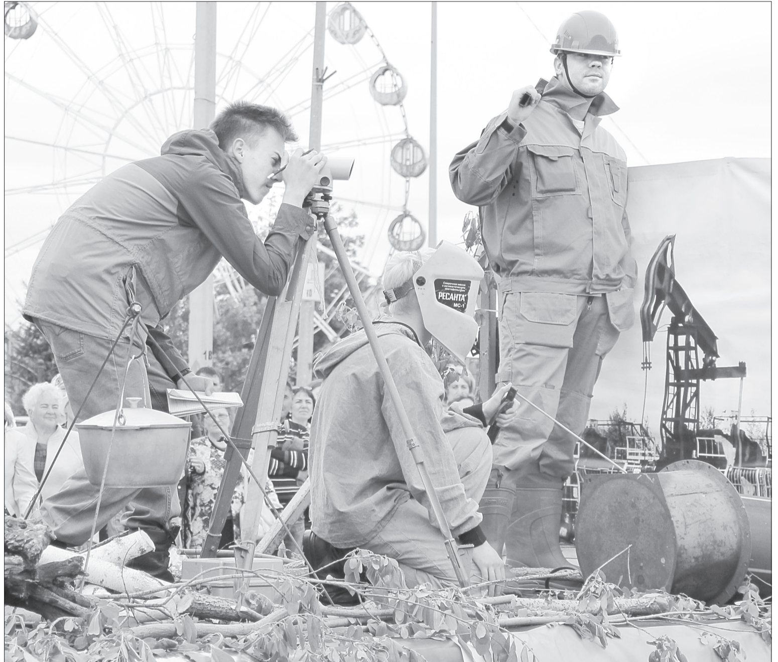
Инсталляция «Покорители Сибири» от сотрудников центральной городской библиотеки

Принять участие в конкурсе можно, обратившись по телефонам: 8-966-762-00-08, 8-932-322-15-17 и на электронную почту: petelina@yandex.ru .