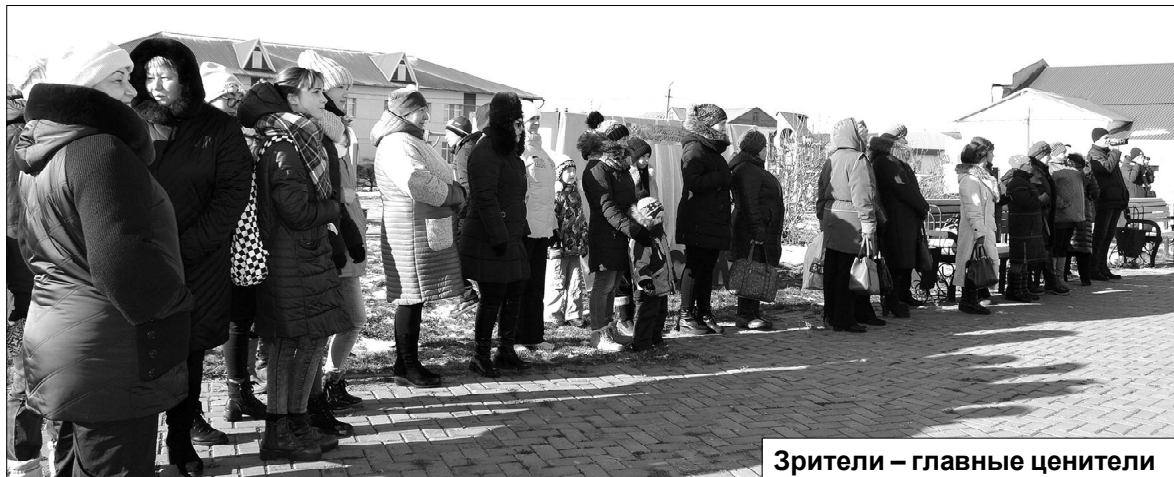
Зрители – главные ценители