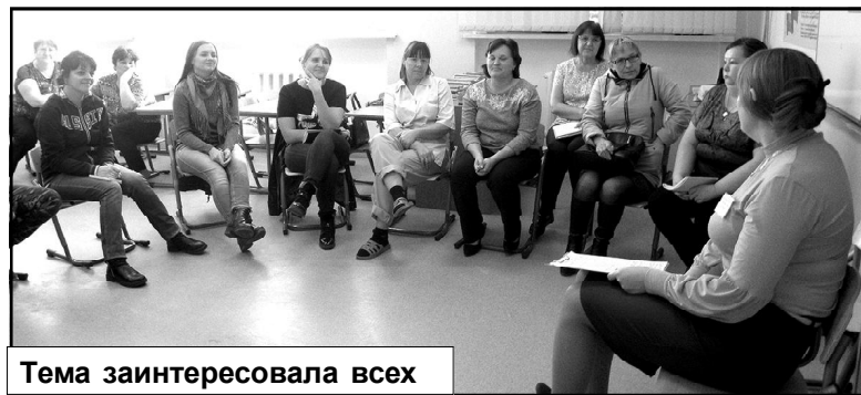
Тема заинтересовала всех

Во вторник, 29 октября, в рамках проекта «Поддержка семей, имеющих детей», в Армизонской средней школе прошел областной Марафон открытых консультаций, в котором приняли участие педагоги и родители.