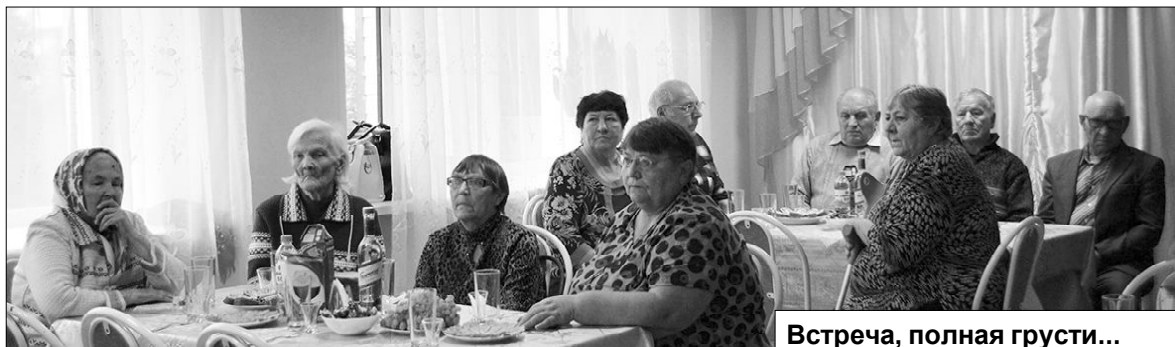
Встреча, полная грусти...