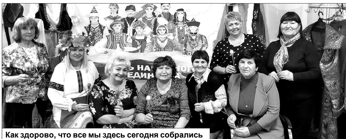
Как здорово, что все мы здесь сегодня собрались