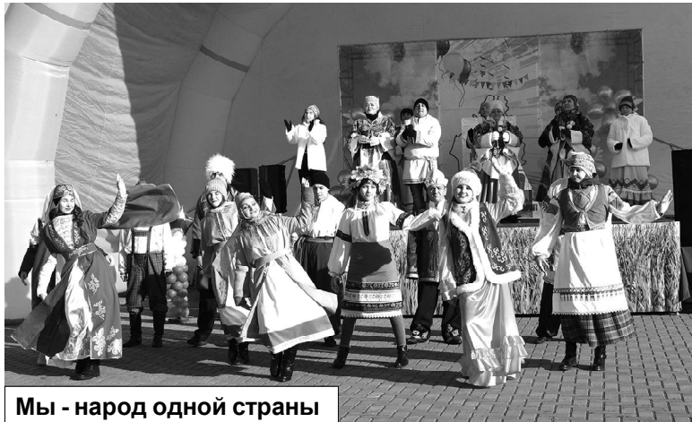
Мы - народ одной страны