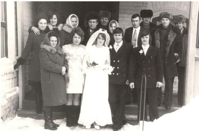
Свадебное торжество 70-х годов

В эти дни исполняется 100 лет со дня образования органов ЗАГС России. История службы, которая ведет летопись нескольких поколений нашей страны, начинает отсчет 18 декабря 1917 года, когда был принят декрет Совнаркома РСФСР «О гражданском браке, о детях и о ведении книг актов гражданского состояния». Эти и последующие документы кардинально изменили сложившиеся традиции фиксации, контроля рождений, бракосочетаний и смертей.