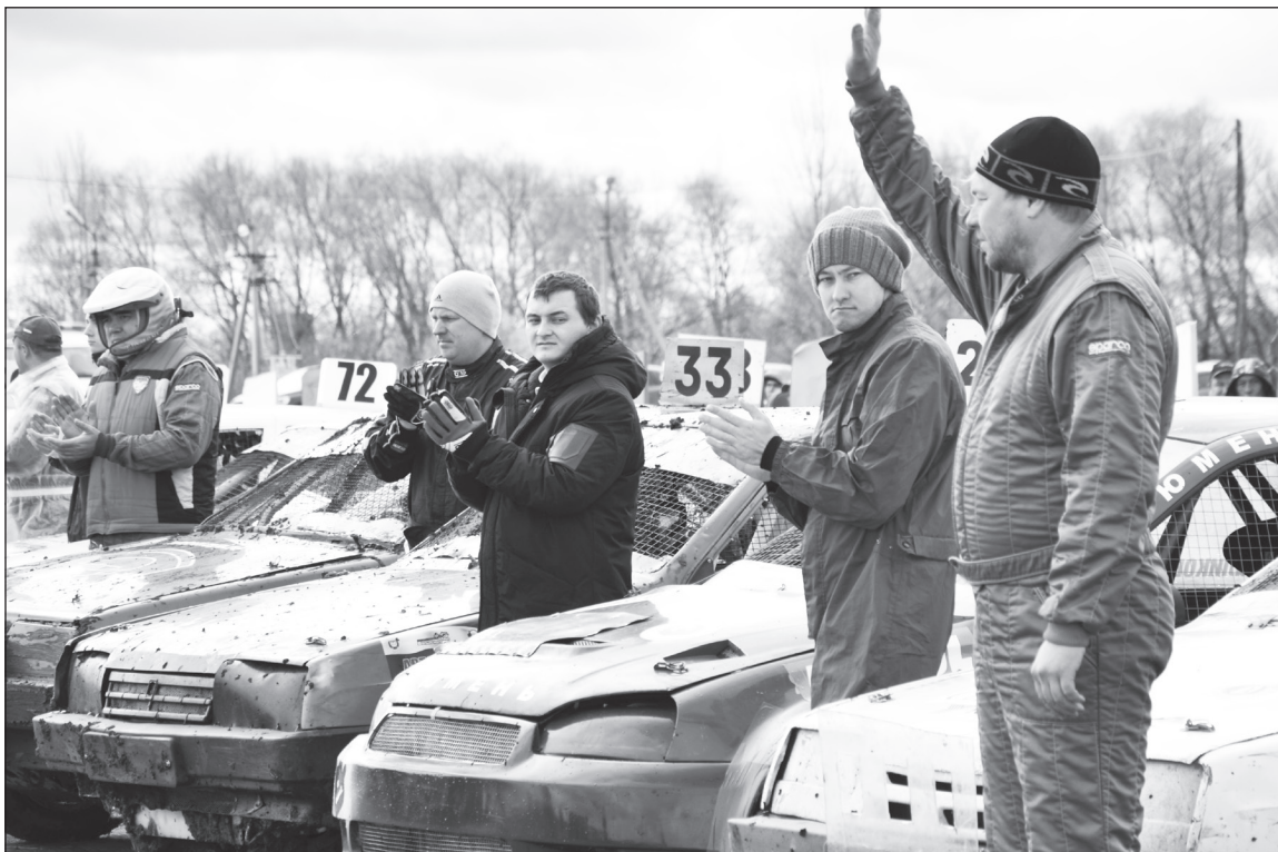
На общем построении приветствуют участников соревнований.