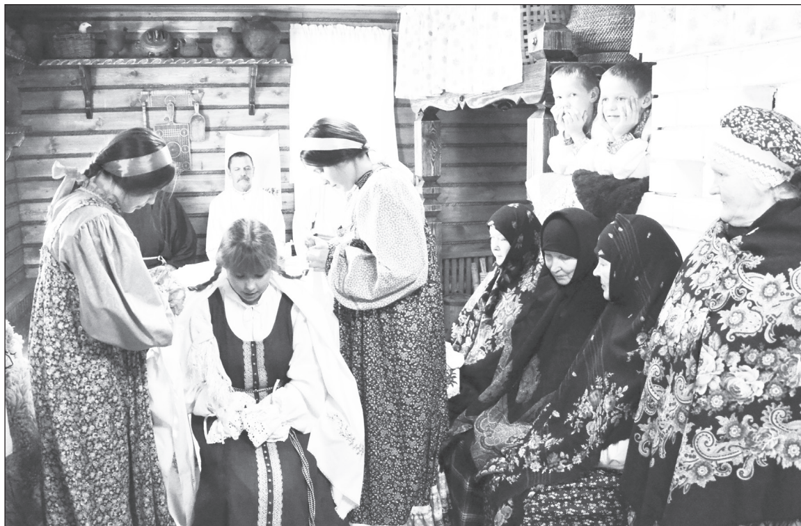
Первым посетителям дома-музея показали свадебный обряд.