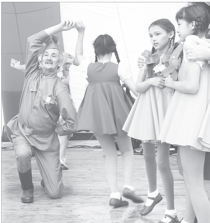
На сцене - ансамбль «Тамаша»

Да будем же достойны поколения победителей!