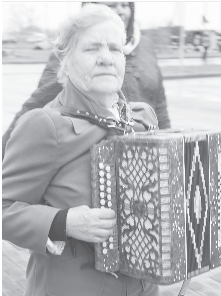
Гармонь «поёт» в любую погоду

Победителям вручены дипломы и подарочные сертификаты. Все команды-участники получили в подарок праздничные торты. Церемония закрытия игры завершилась, а команды строем, чеканя шаг, покинули площадь под звуки любимого солдатского марша «Прощание славянки».