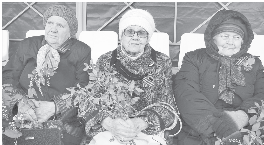
Ветераны труда принимают парад

низированного класса вынесли на площадь щиты с изображениями самых значимых наград Великой Отечественной войны. А все пространство