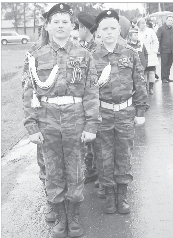
Воспитанники военнизированного класса «Альфа»

Холодная погода способствовала тому, что аппетит у гостей праздника разгулялся. К тому же манила запахом полевая кухня во «дворе» спорткомплекса. Организаторы позаимствовали её у воинов за-