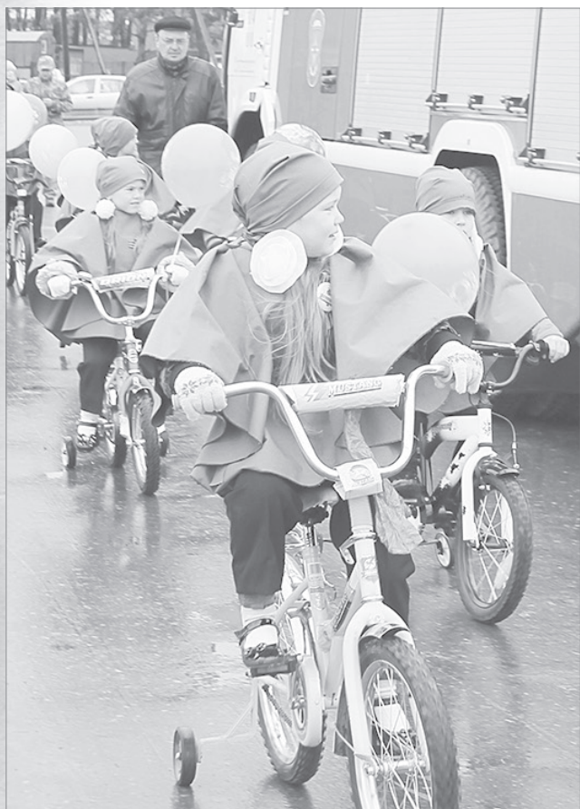
За рулём - детсадовцы

Зазвучали проникновенные строки, и, казалось, каждый участник этой патриотической акции испытывал и боль, и гордость за своего родного человека, чей портрет держал в руках.