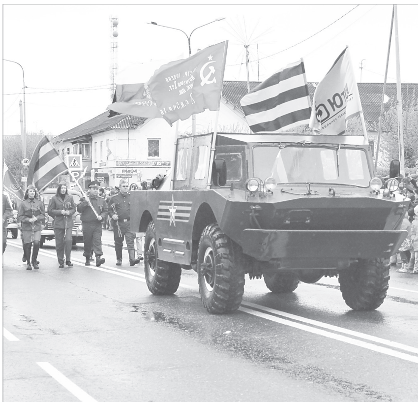
В праздничном параде