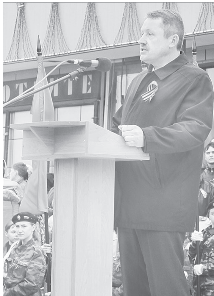
Поздравление от главы города

митинг плавно и органично перешел в театрализованное действие. Зазвучала мелодия песни «Поклонимся великим тем годам», и ребята из вое-