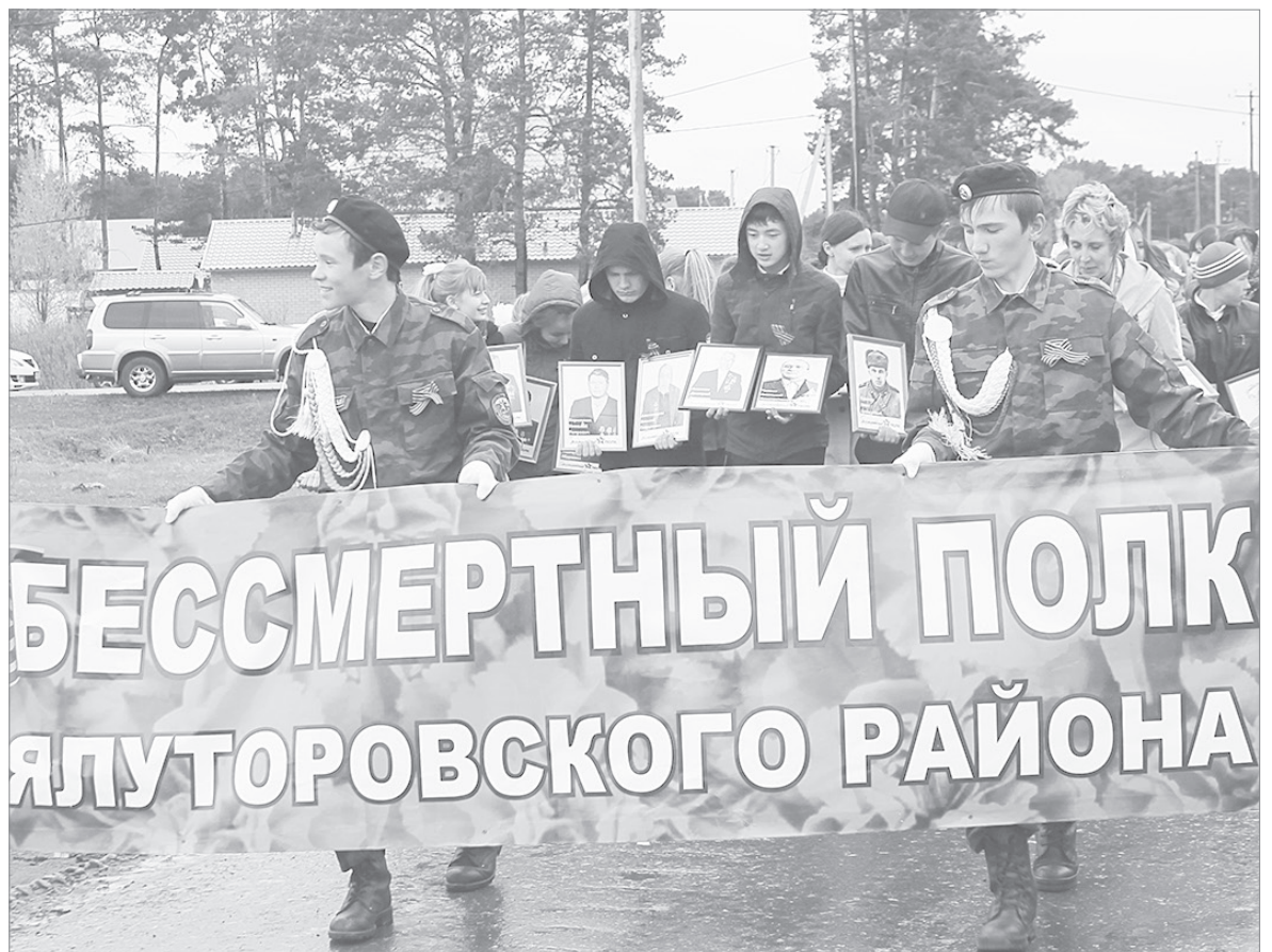
В полку - более двухсот портретов