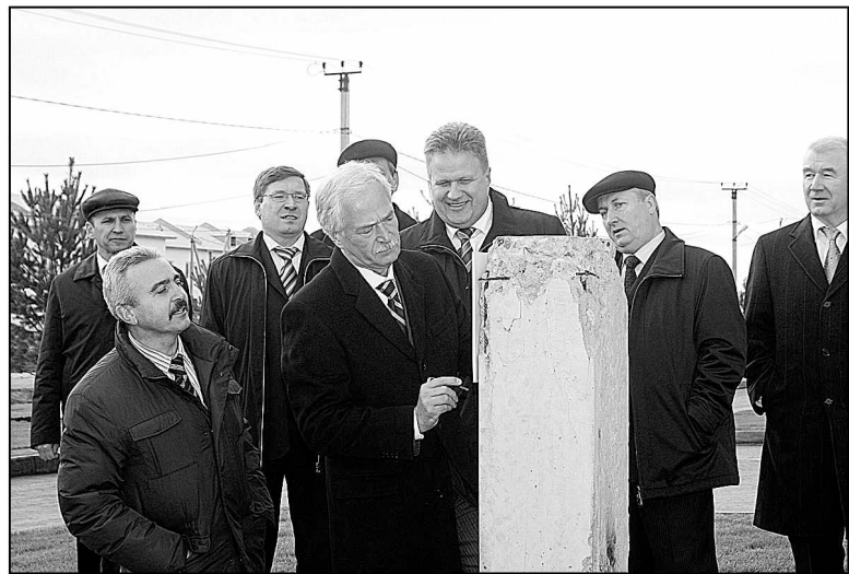
Борис Грызлов расписался на символической свае поселка Молодежный. 2007 г.

ном образовании открыли учебный центр компании «Шлюмберже».