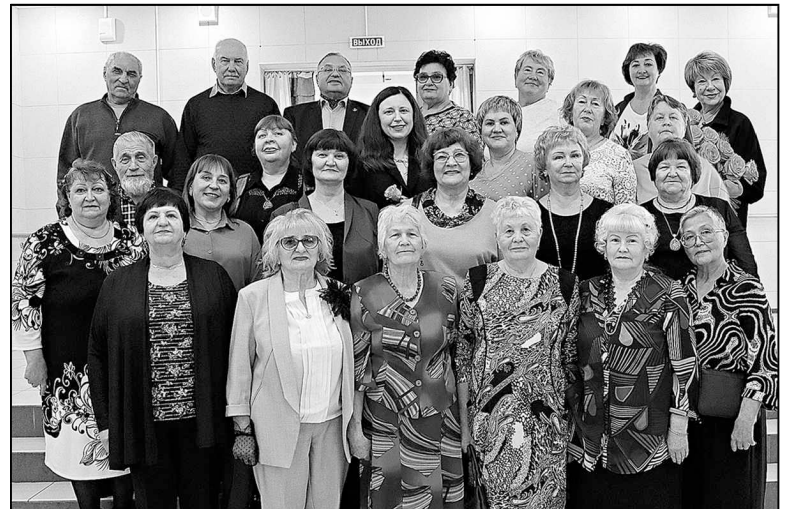
Участники встречи в ЦКиД «Премьера».