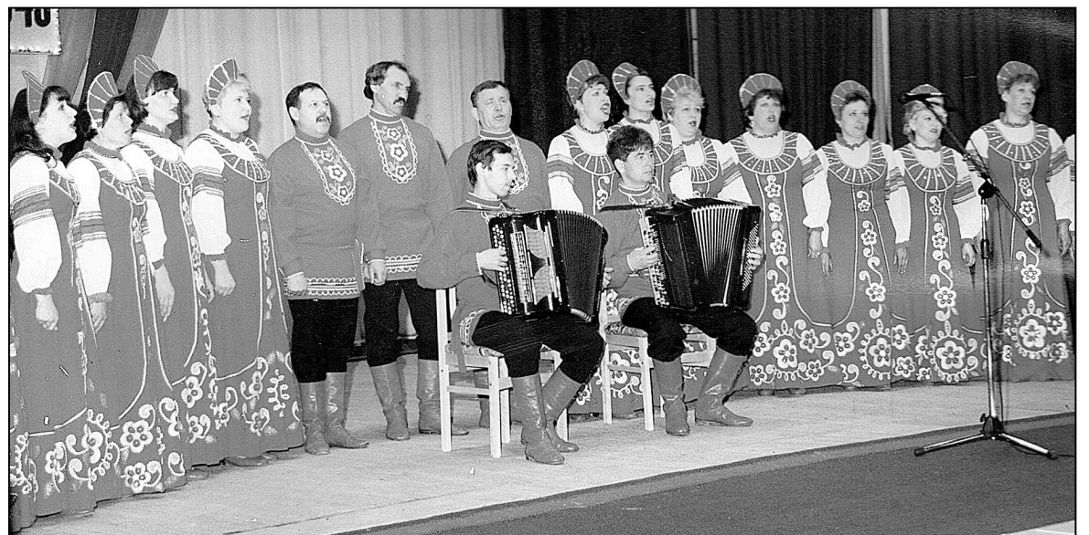
Выступает хор «Русская песня».