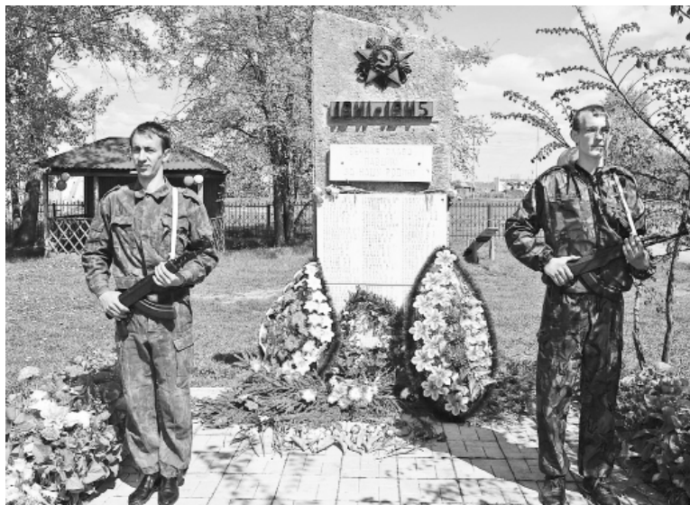
* Памятный пост