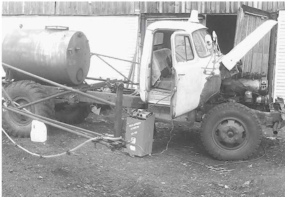
* Обновлённый опрыскиватель

Для рапса готовим пятьдесят процентов паров и другая половина – после пшеницы.