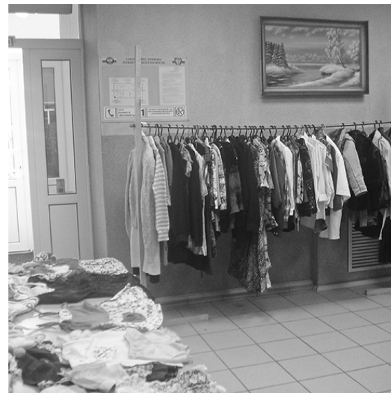
* Во время акции