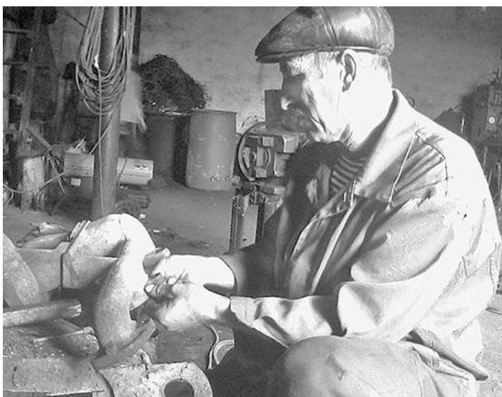
* Текущий ремонт техники