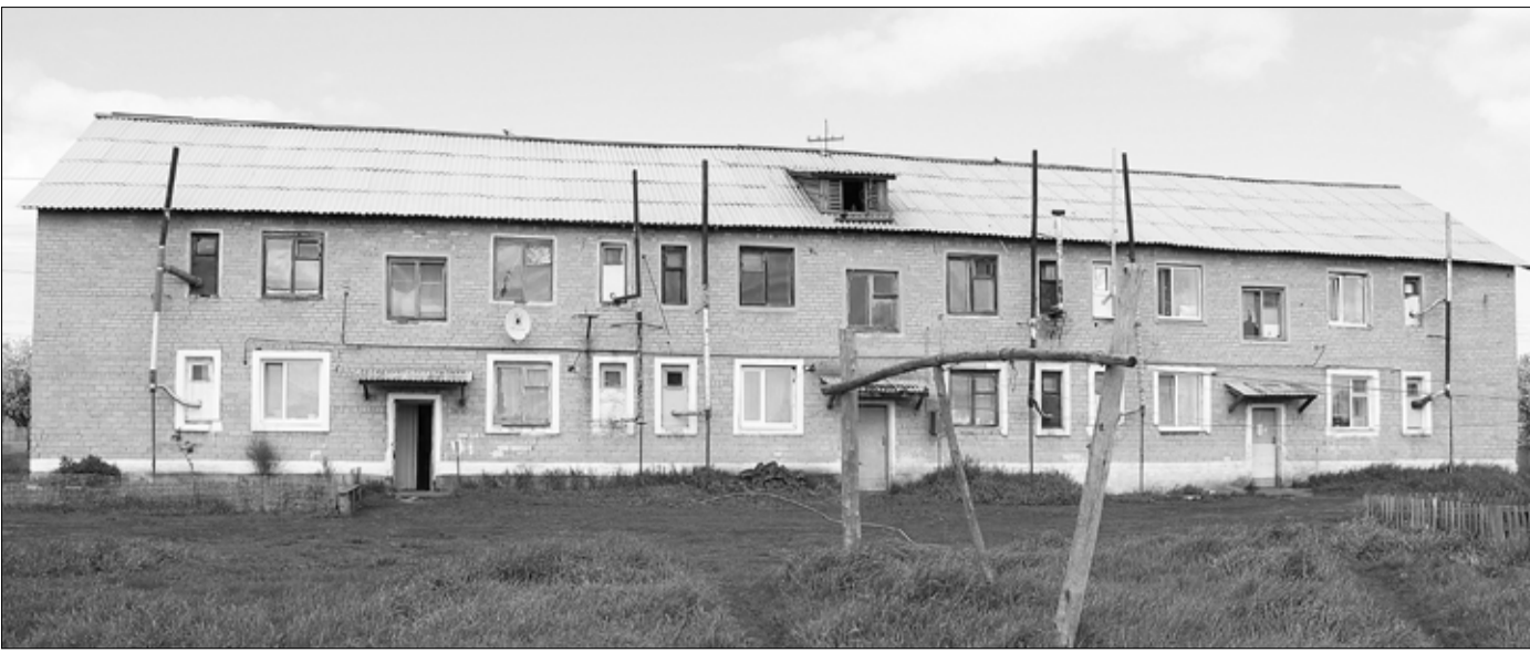
Снаружи многоквартирный дом № 5 по улице Северной в Усть-Ламенке выглядит вполне прилично