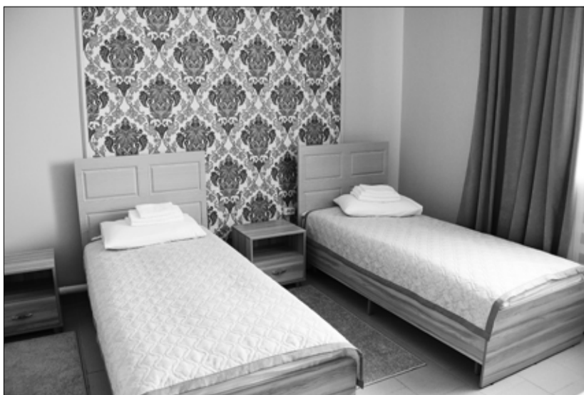
Номера оформлены со вкусом – в каждом подобрана индивидуальная цветовая гамма, дизайн интерьера и текстиля. Мебель выполнена на заказ

Наталья ГЛАДКОВСКАЯ.