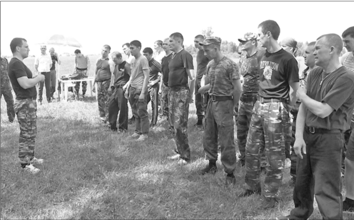
Полицейские из Аромашево, Бердюжья и Голышманово состязались в силе, выносливости, меткости