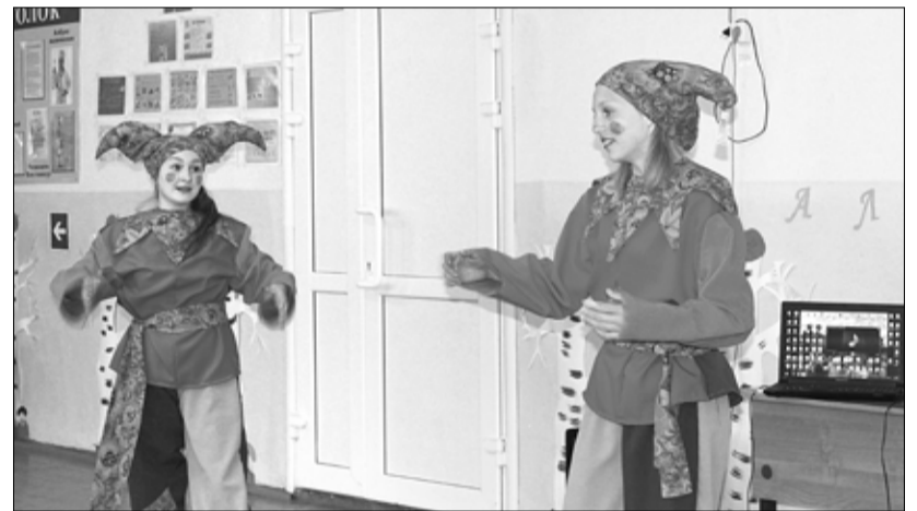
Скоморохи зовут на представление