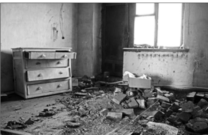
В двух заброшенных квартирах всё засыпано кирпичами и отвалившейся штукатуркой