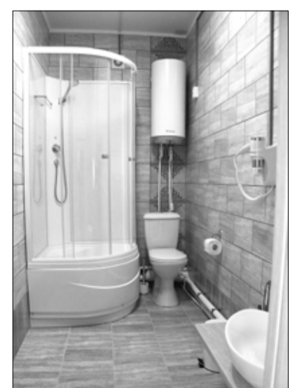
На устройство санузлов потратили немало сил и средств. Результат того стоил