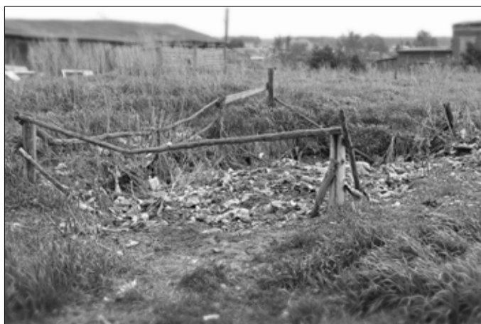
Свалка возле дома «маскируется» в бурьяне