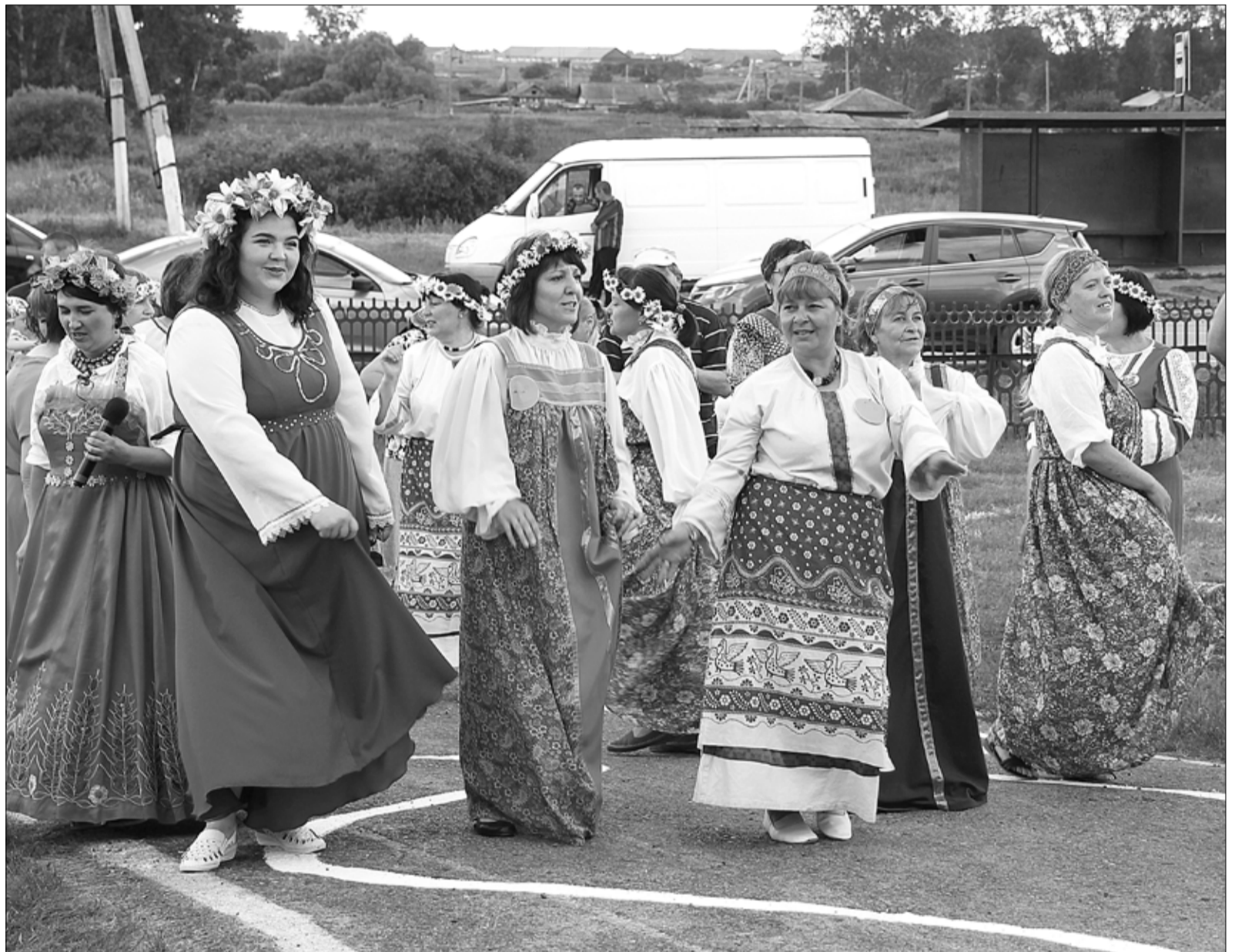
Народное гулянье в Усть-Ламенке сопровождалось шумным хороводом и задорными конкурсами