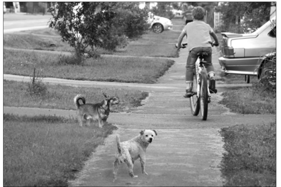
Не все бродячие собаки миролюбивы