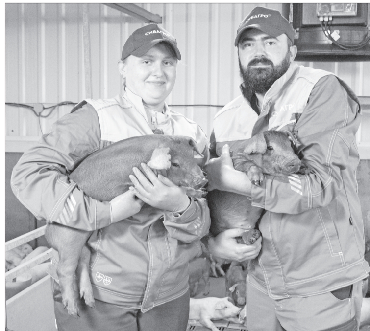
Дружная команда Тюменского свинокомплекса «Сибagro» ежегодно улучшает производственные показатели.