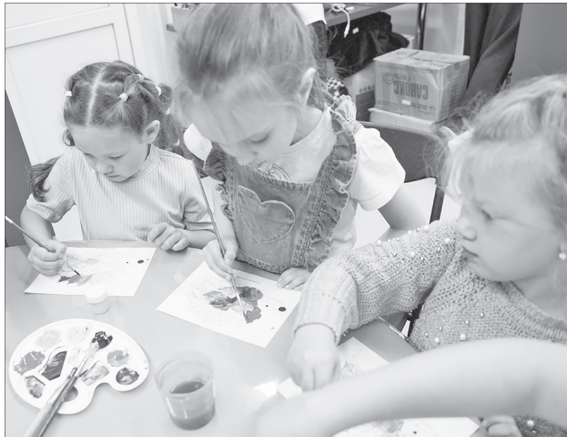
Из под кисти юных художников рождаются шедевры.

Мы стараемся идти в ногу со временем, изучаем потребности подрастающего поколения и предлагаем такие варианты, которые заинтересуют детей и подростков и помогут им развиваться в полной мере.