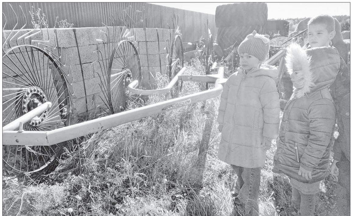
■ Быть может, это будущие комбайнёры сейчас уже знакомятся с сельским трудом.

От детского сада воспитанники двинулись по улице Советской к Рабочей, для чего им надо было пересечь дорогу, и тут ребята вспомнили правила перехода. Около Дома культуры поговорили о различных мероприятиях, которые здесь проводятся для жителей села. Во время экскур-