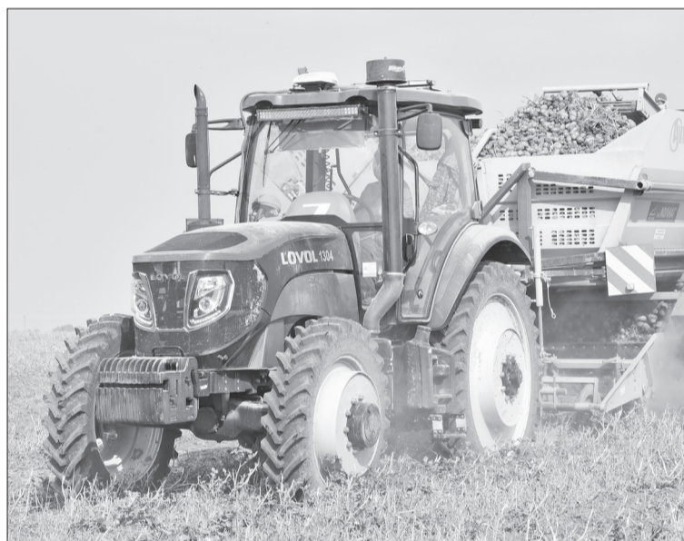
В ООО «АП «Продукт» используют современную технику и выращивают лучшие сорта картофеля.