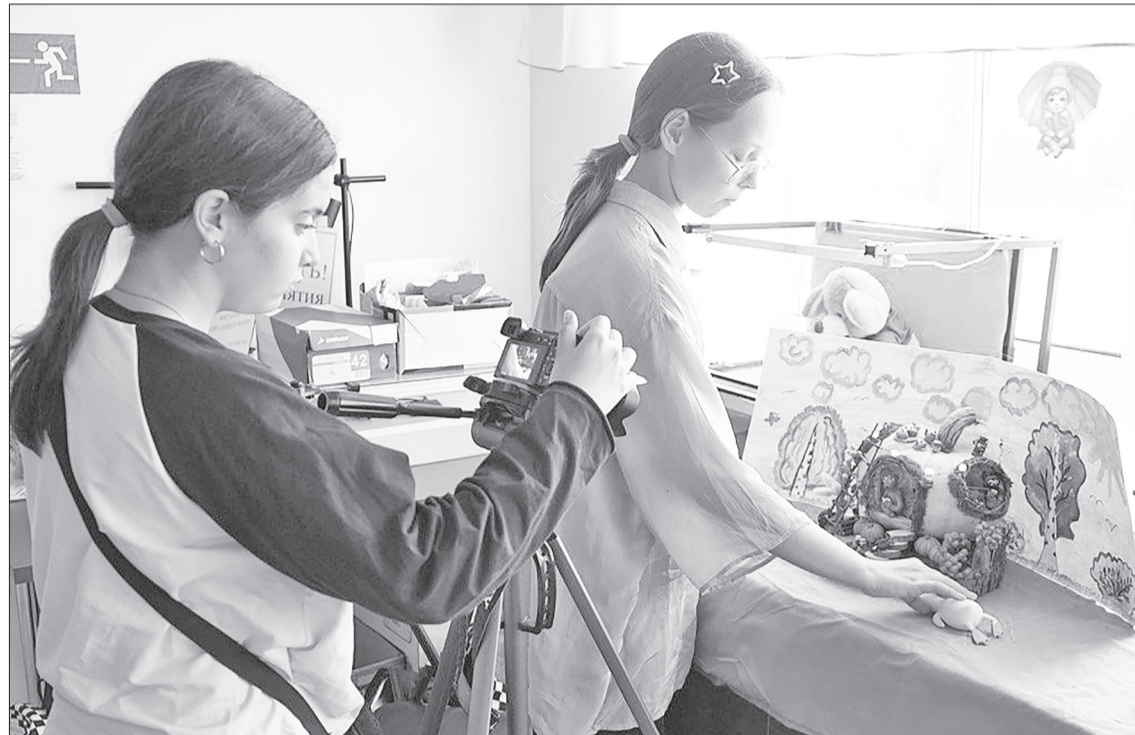
Воспитанники студии «ЛИС» за созданием очередного ролика.