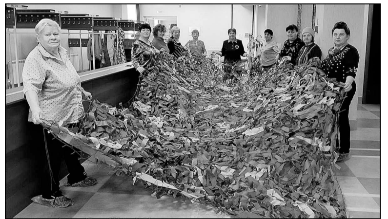
Очередная сеть готова!