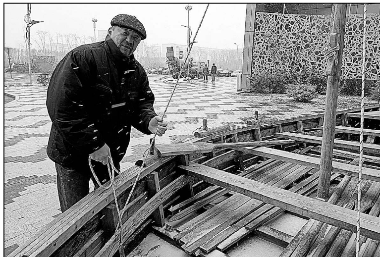
Реконструктор и его судно.