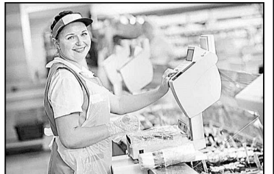
График работы 2/2 с 09:00 до 20:00 час. По всем вопросам обращаться по тел.: 8-909-189-03-57, 8-982-989-46-99. Готовы рассмотреть кандидатов без опыта работы. Всему научим.

МЫ ПРЕДЛАГАЕМ: - удобный график работы; - официальную заработную плату; - работу рядом с домом. Опыт работы в розничной торговле и продуктами питания приветствуется. Знание кассовых отчетов и кассы будет преимуществом.