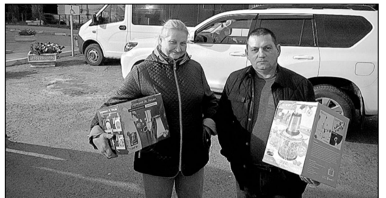
Бытовые приборы ускорят работу на заготовке сухих супов.