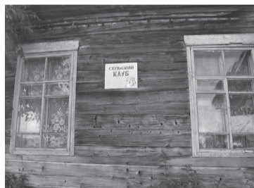
Окна сельского клуба...