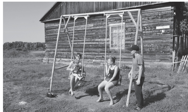
На улице Школьной (школы в деревне нет, а память о ней живёт)...