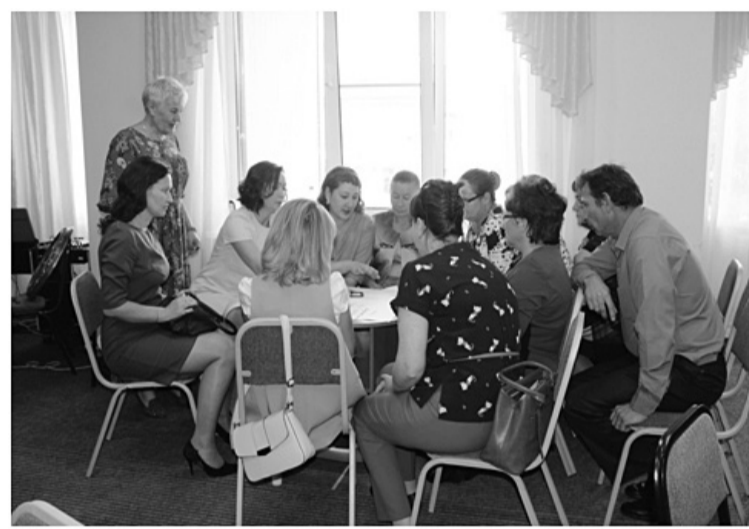
Сообщения по итогам работы дискуссионных площадок были заслушаны во время пленарного заседания.