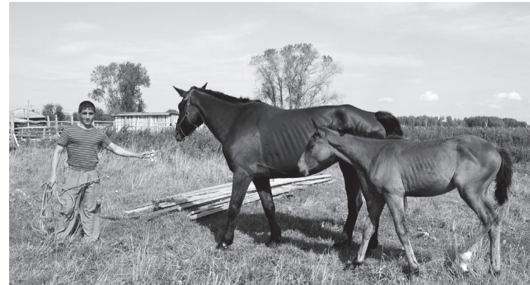
От лошадей гармония исходит, тепло и доброта...