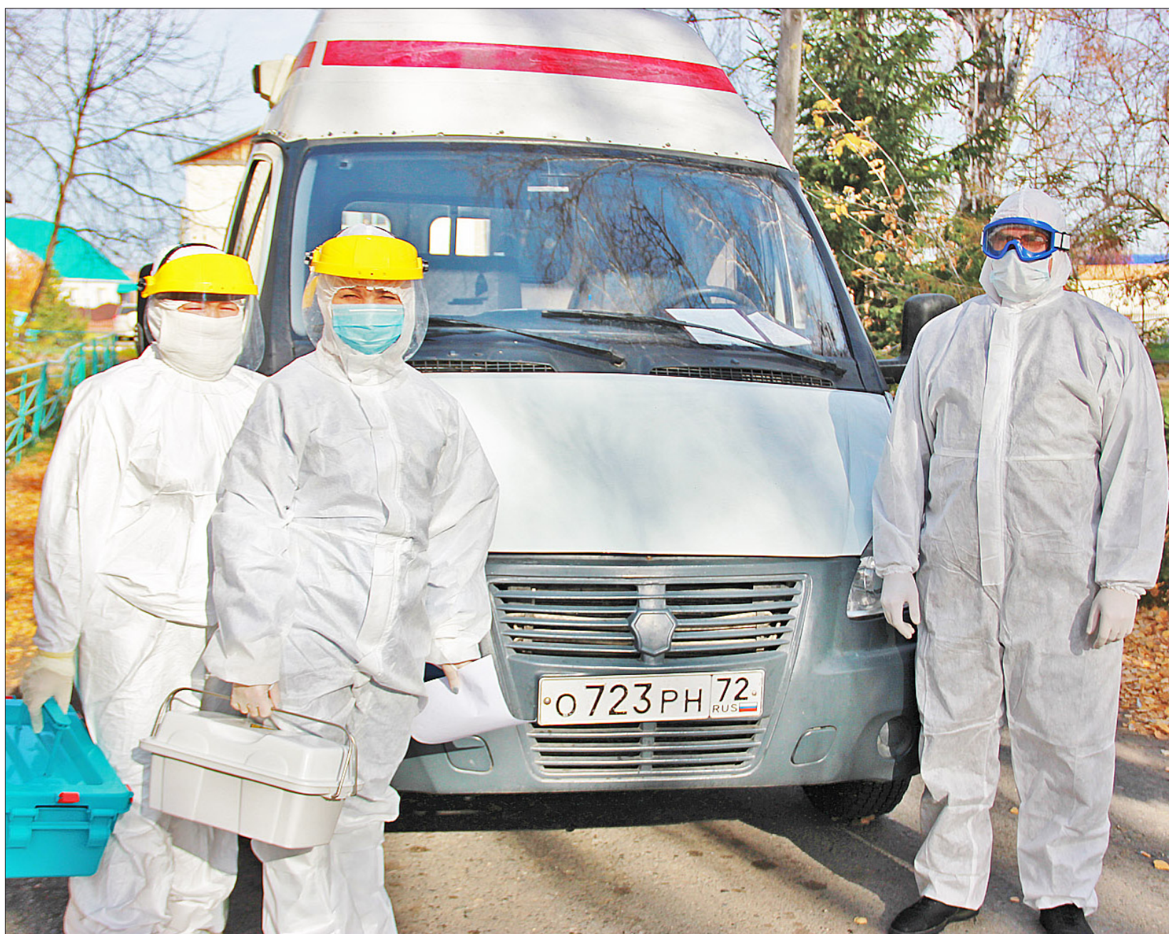
Каждый день медицинские работники до десятка раз выезжают по вызовам к пациентам на дом

жители региона стали чаще болеть пневмонией различного генеза. За неделю (с 5 по 11 октября) зарегистрировано 1238 случаев внебольничной пневмонии (за предыдущую неделю – 1012), темп прироста – более 22 %.