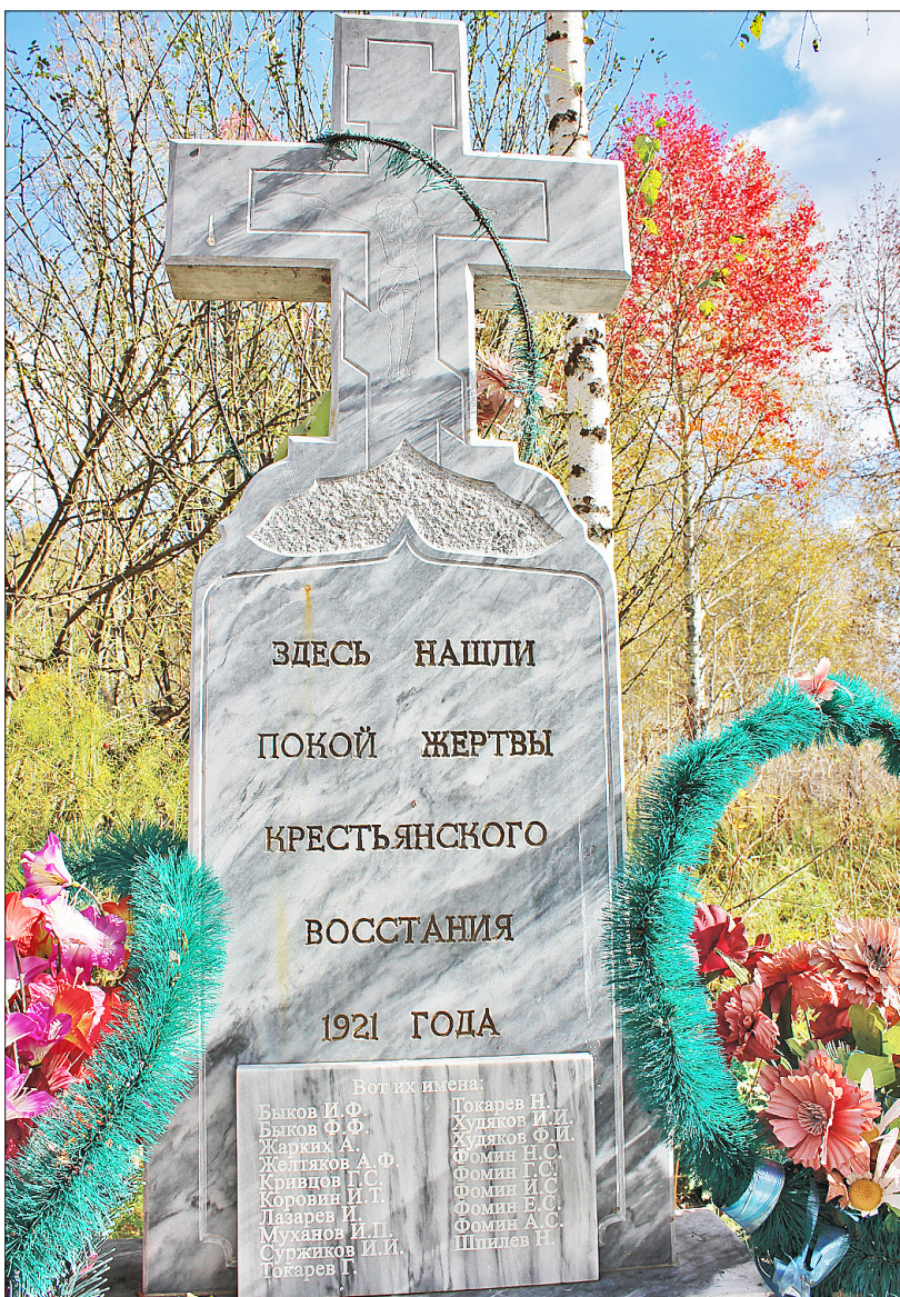
Памятник в Новопокровке над единственной известной на сегодня во всём Приишимье братской могилой крестьян? убитых красногвардейцами во время восстания