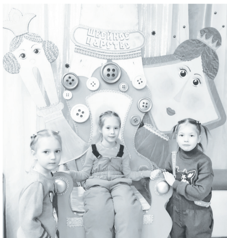
На экскурсии в Доме моды у главного волшебника.

Одним из самых волшебных мест нашей программы стала почта Деда Мороза. Именно туда приходят письма с пожеланиями и поздравлениями со всех уголков мира и страны. Огромные стеллажи с конвертами с сокровенными желаниями маленьких и взрослых отправителей расположились в одной из комнат, там их сортируют и обрабатывают в течение года. Стены увешаны самыми интересными и необычными посланиями. Здесь же можно увидеть рекордные письма (самые большие, самые маленькие или самые короткие). Есть и такие, которые писали целые группы школьников, детсадовцев и даже солдаты. Именно там вы