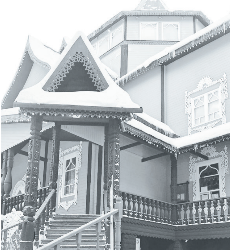
Двухэтажный терем в центре вотчины Мороза.