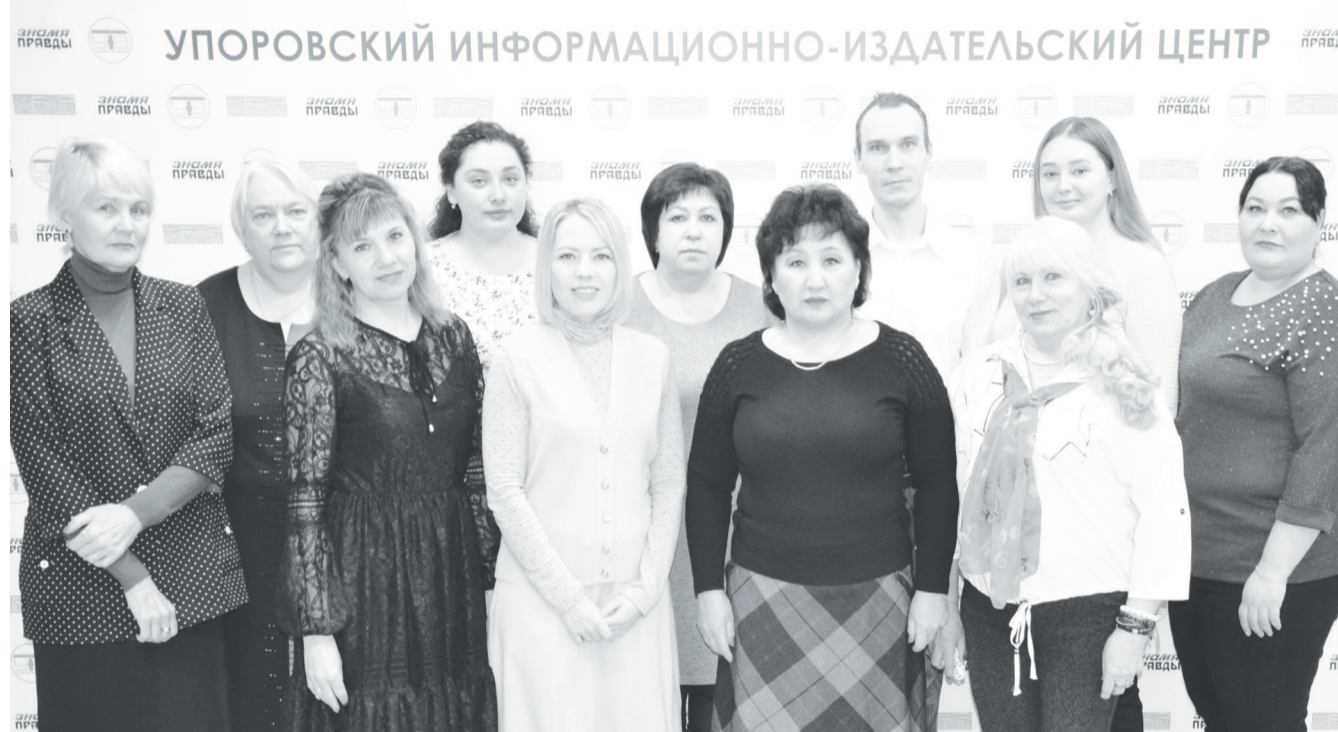
Коллектив редакции не в полном составе. Не всегда удаётся собраться вместе.