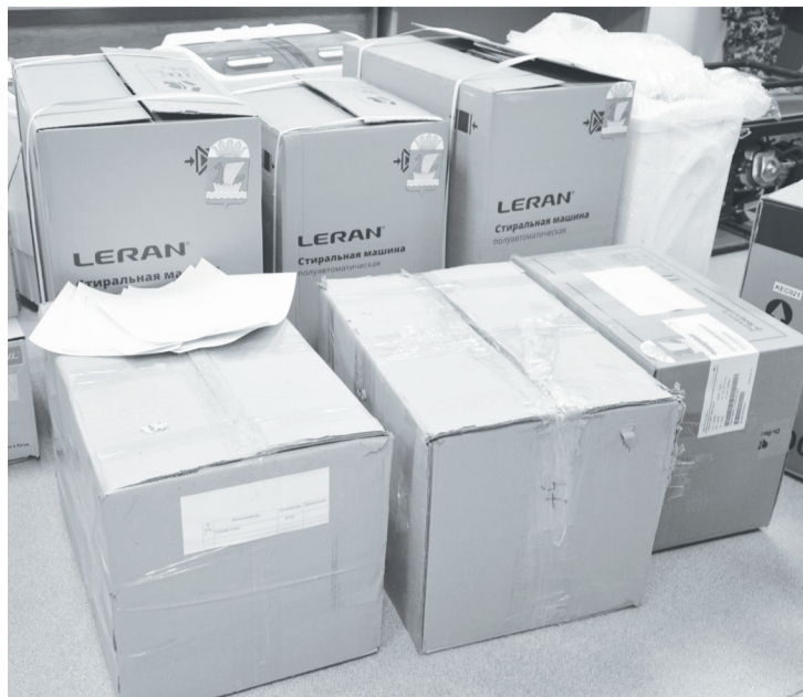
Собран очередной груз для военнослужащих.