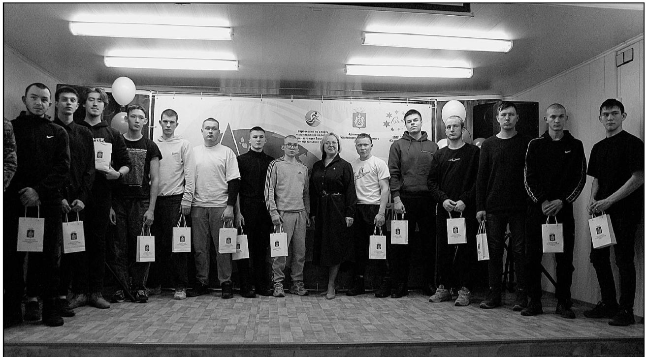
Осенью 2024 года ряды Российской армии пополнят 230 жителей «столичного».