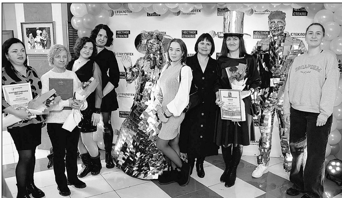
Сотрудники отдела технического контроля завода «Стеклотек».