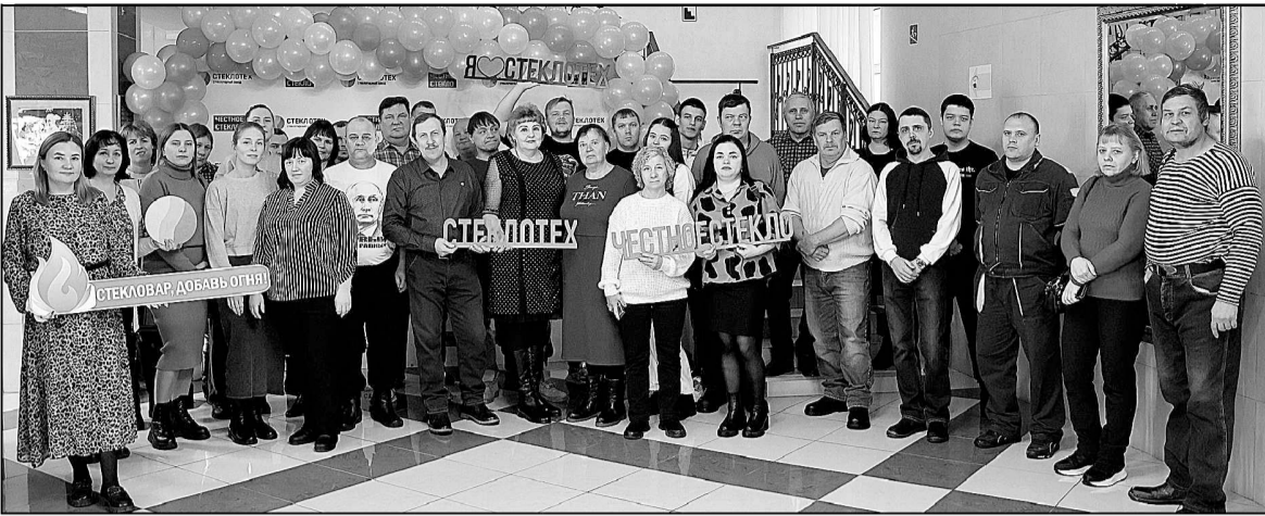
Сотрудники «Стеклотек». Фотография на память.