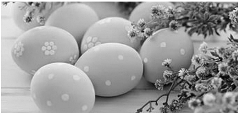
* Яйцо — символ христианского праздника, непременно блюдо пасхального стола.

яйцо куриное сырое — 10 штук; луковая шелуха; зелёнка аптечная — 1 маленький флакон;