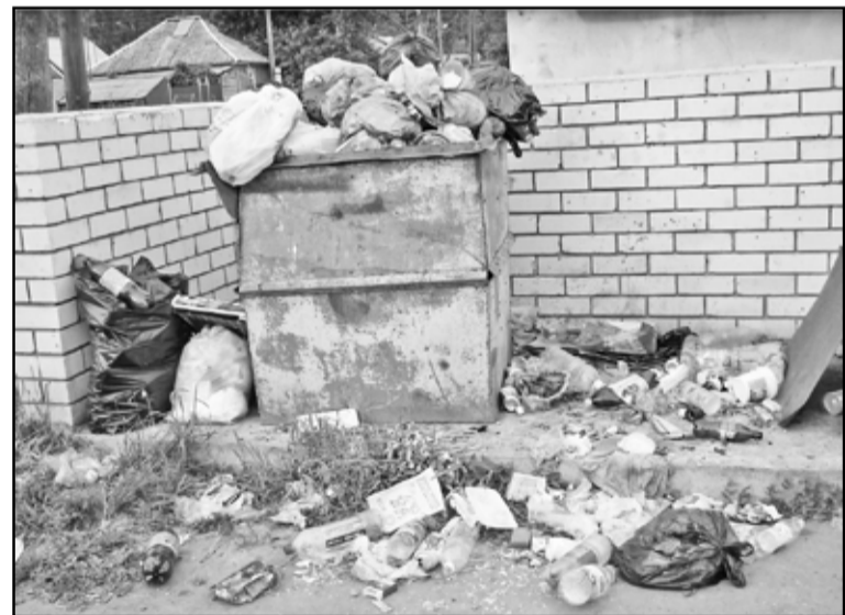
Свалка мусора у контейнера

– Нам надо выстраивать цивилизованные рыночные отношения между производителем и потребителем услуг в сфере ЖКХ. Это действительно первостепенная экономическая задача. Но мы должны одновременно приучить потребителя к рациональному и бережливому отношению к предоставляемым услугам. Ведь ни для кого не секрет, что часть за-