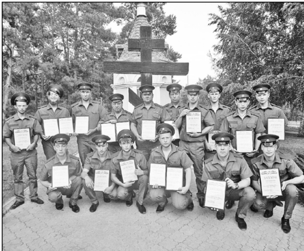
Сибирская делегация слёта казаков

Молодые казаки посетили Государственный музей-заповедник Михаила Шолохова, побывали на месте захоронения великого писателя. От экскурсоводов представители