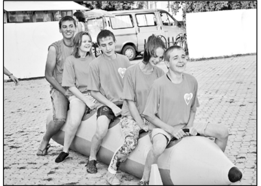
Перемещаться на банане впятером – задание не из лёгких

лы увидели лишь часть праздника. День молодёжи совпал с их выпускным вечером. Красивые и яркие, они, ненадолго озарив улыбками и зажигательным танцем гостей, стремительно удалились, чтобы завершить свой выпускной вечер. Кто пришёл, уходит и не думал.