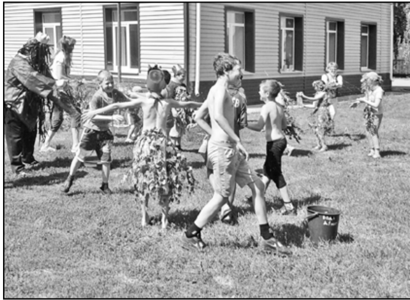
День здоровья прошёл интересно и весело

Каждый день был необыкновенным и проходил в атмосфере веселья. Постарались все работники ла-