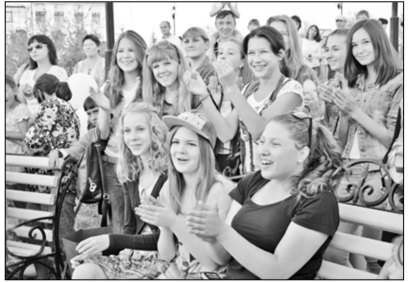
Благодарные зрители бурными аплодисментами встречали группу «Робинзон»

Молодёжный вечер окончился дискотеккой. Немного жаль, что нынешние выпускники Казанской шко-