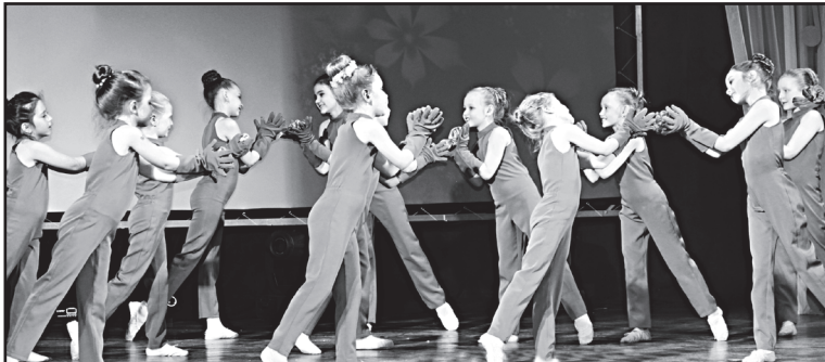
Эстрадный танец «Букет»