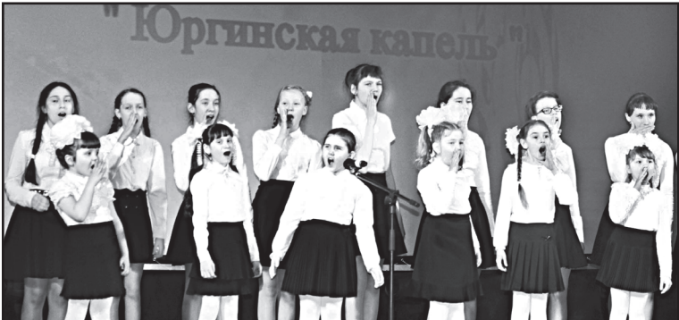
Хор Омутинской ДШИ