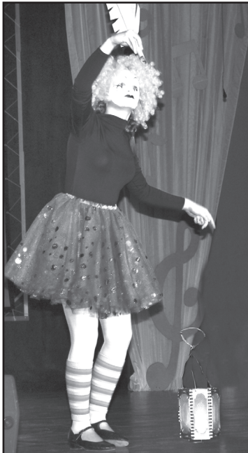
В гостях у муз

Т. УСОЛЬЦЕВА