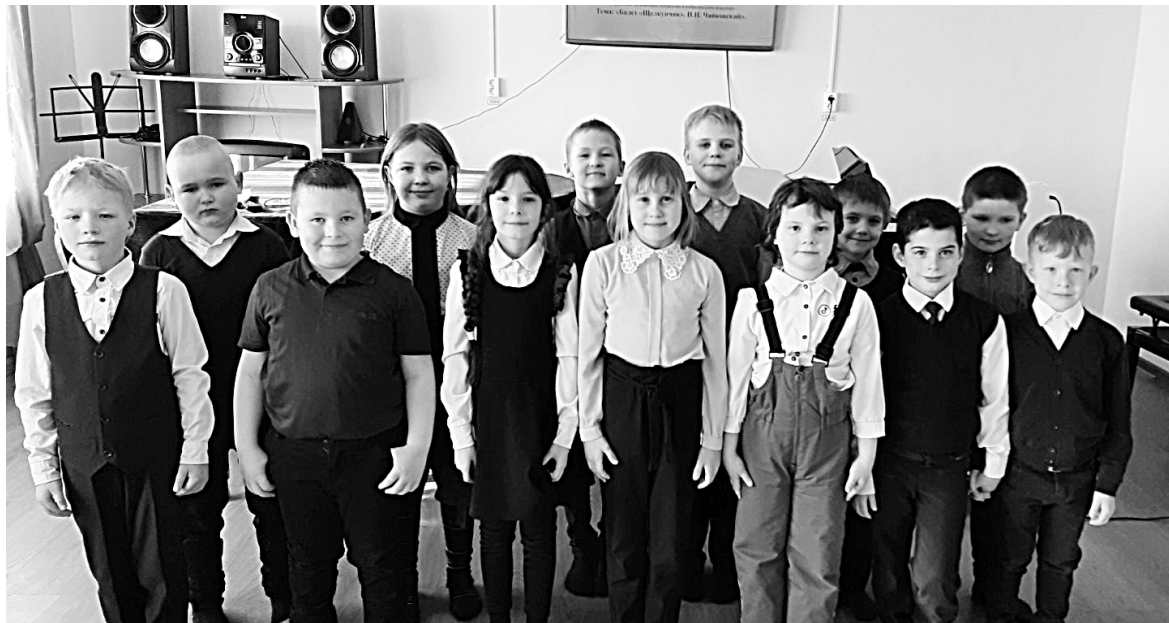
Первоклассники стали частыми гостями в детской школе искусств