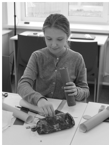
Моделирование начинается с создания макетов из бумаги