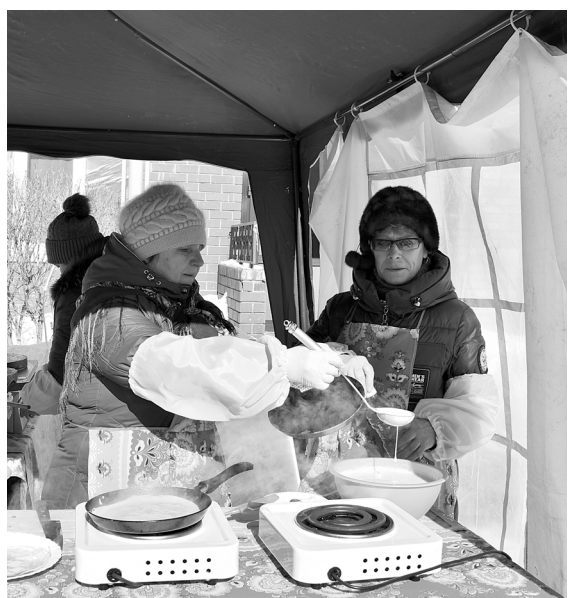
На празднике главным угощением были блины с пылу с жару