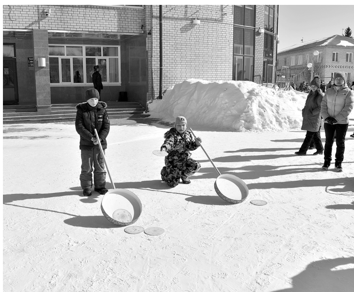
Ребятня с азартом участвовала в народных забавах. Самые смелые наравне со взрослыми даже пытались выиграть барана