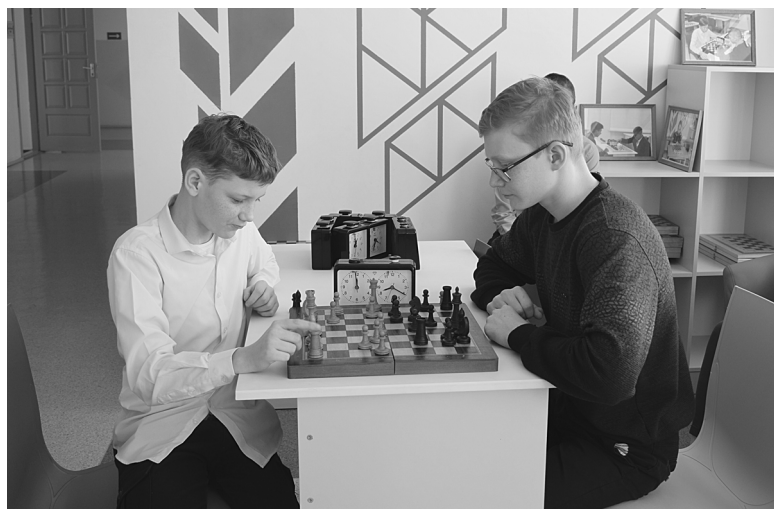
На переменах ребята увлеченно играют в шахматы

Не забудьте подписаться на районную газету «Новая жизнь» на второе полугодие 2021 года!