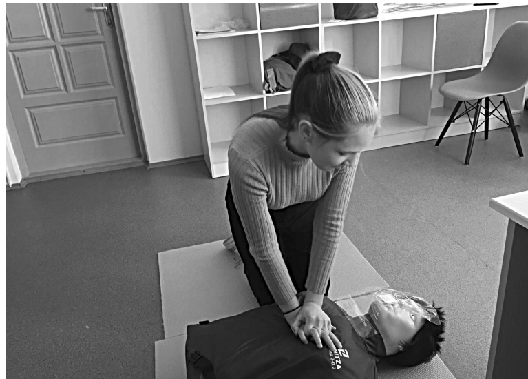
Оборудование в «Точке роста» позволяет ученикам на уроках ОБЖ научиться навыкам первой медицинской помощи