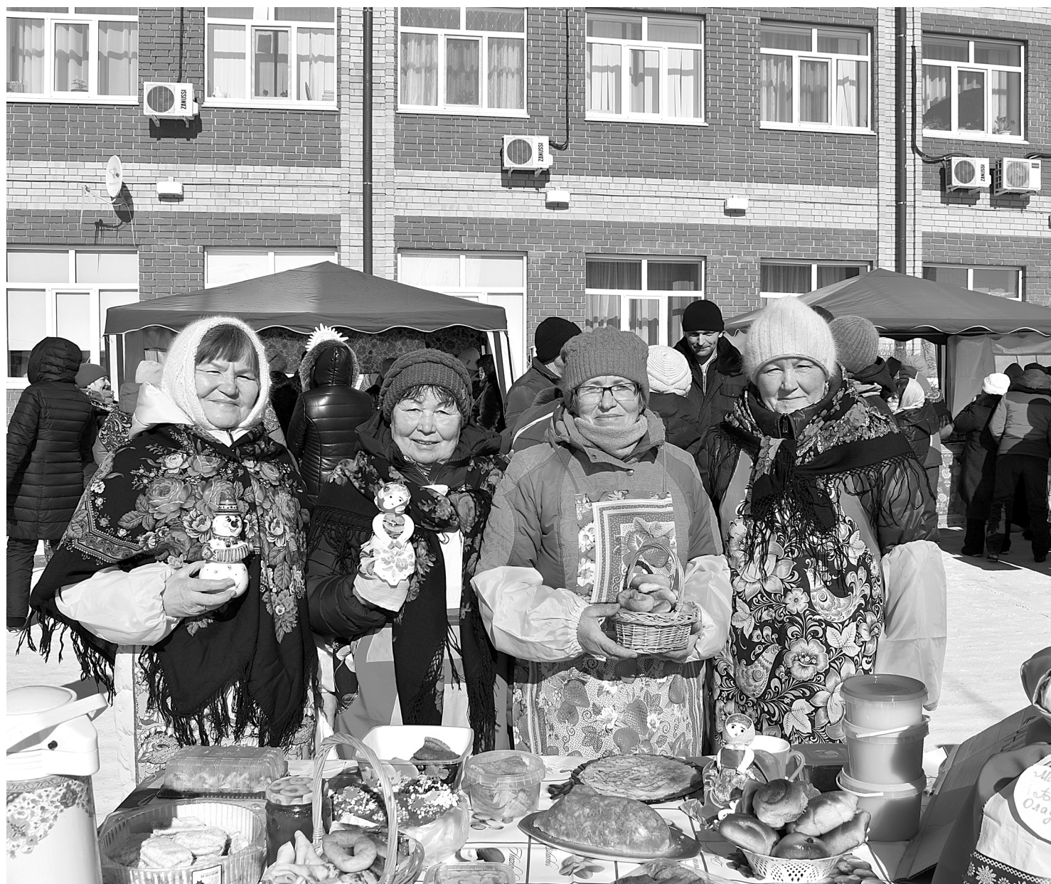
Ветераны специально к Масленице приготовили фирменные блюда и с удовольствием угощали ими бердюжан

С азартом селяне участвовали в спортивных состязаниях. Хорошие призы для настоящих хозяев – электросушилка для фруктов и овощей, аккумуляторная