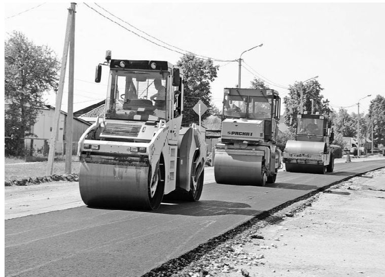
➤ Фото из архива Татьяны СУХОВОЙ