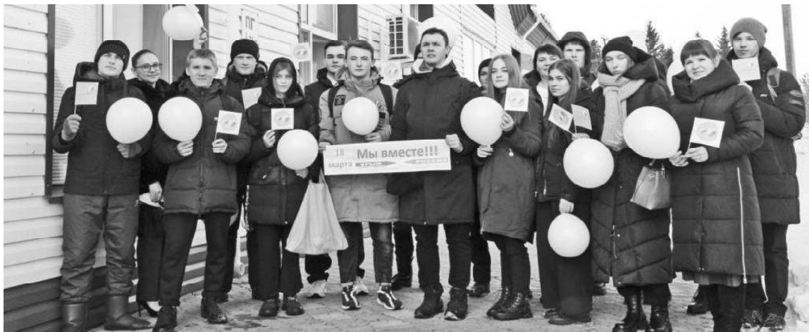
➤ Флешмоб в районной библиотеке