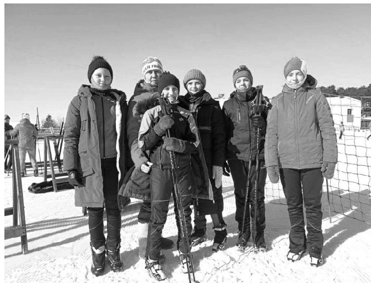
» Викуловские лыжники в Заводоуковске

12 марта на лыжной базе состоялись соревнования по лыжным гонкам среди мужских и женских команд «Закрытие зимнего сезона» в рамках областно-