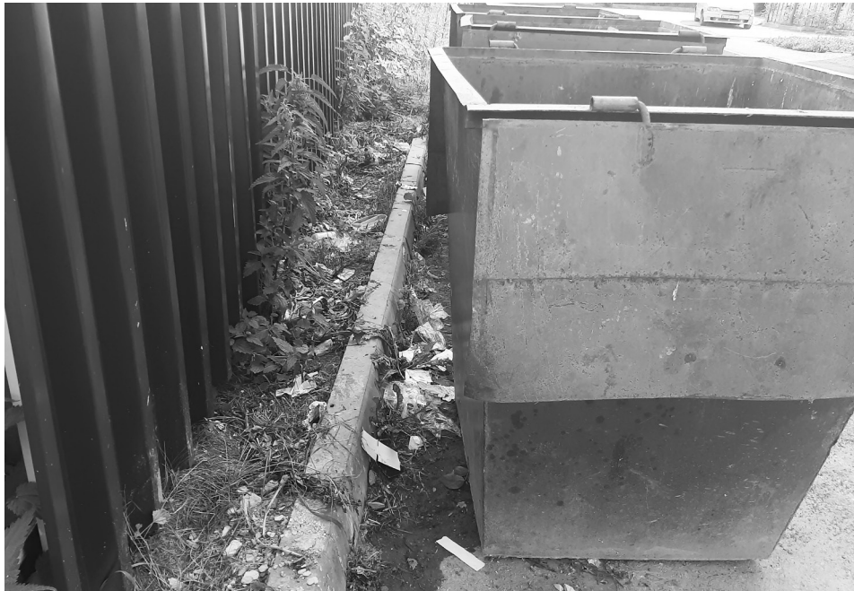
Закрывайте мусорные баки, чтобы животные не растаскивали отходы.

Приучить человека можно практически ко всему, главное в этом деле – действовать долго, последовательно и упорно. Основной принцип такого социального воспитания очень прост: хочешь, чтобы правило выполняли, сделай так,