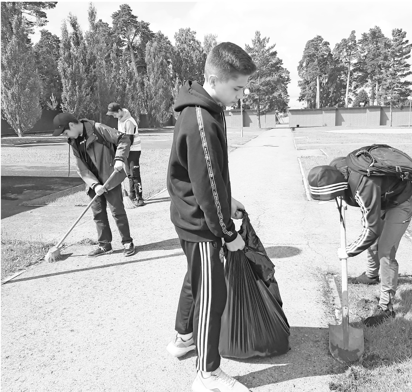
Школьники отряда главы прибирают общественную территорию.