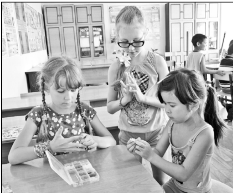
Одно из любимых занятий в отряде — плетение фенечек