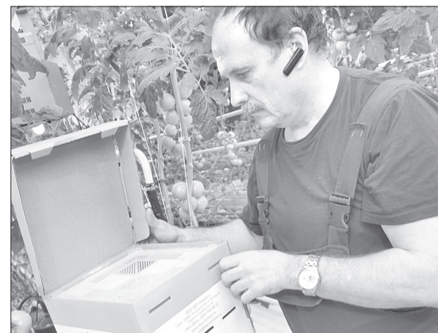
Внешне улей, где живут шмели, выглядит как обычная коробка, но внутри целая система ящичков и решеток, чтобы насекомые чувствовали себя комфортно

Около 2,4 млн яиц ежедневно отправляются в торговые сети и с птицефабрики «Боровская». Дефицита на этот продукт в регионе тоже не ожидается. По словам начальника яйцесортировочного цеха Владимира Бузрина, традиционный спрос приходится в канун Пасхи.