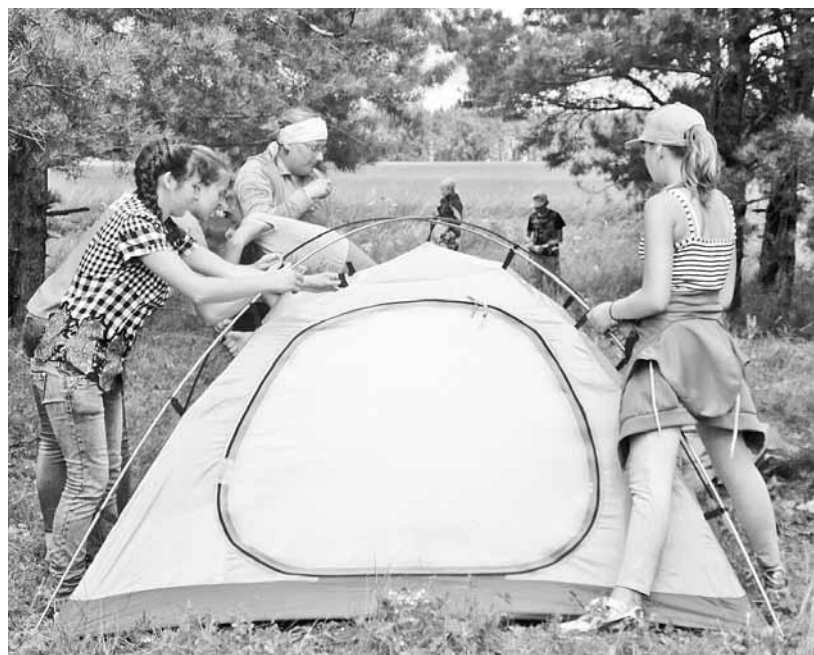
Ставить палатку научится каждый из тех, кто побывал на туристической смене