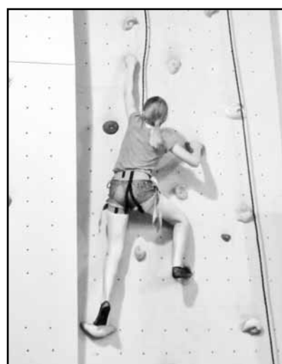
Тренировки на скалодроме любят все ребята

Сегодня попасть в ильинский лагерь может любой желающий, но предварительно он должен сделать