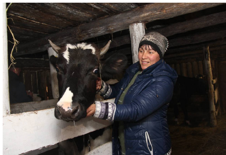
► Е. И. ШЕНЕР, д. Петрова // Фото Татьяны СУХОВОЙ.

Иван ИГИШЕВ, старший инспектор ОНДПР по Вуковскому району