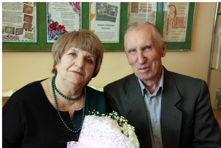
➤ Н. Н. и Ф. Г. Тесля – «Золотая семья».