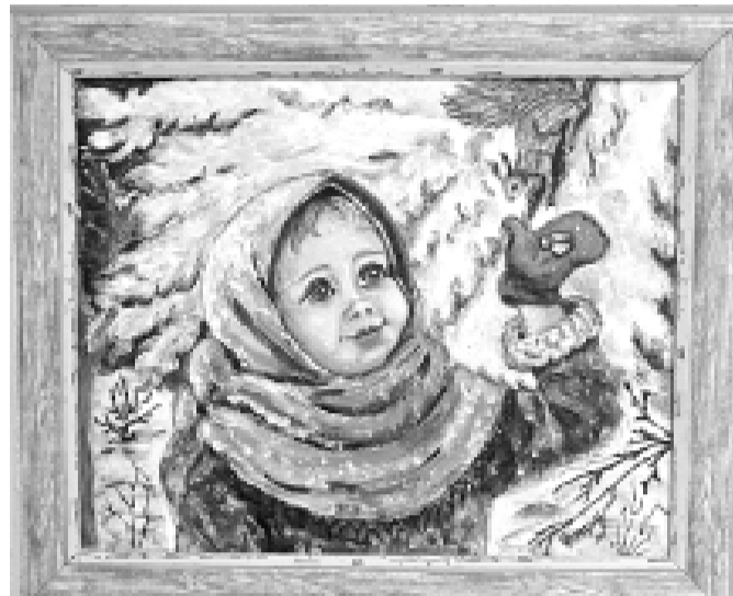
Л.В. Кривошеина «Шурочка», 2015 г.

латы Тобольска Фаязу Музафарову. После приветственных слов они провели церемонию награжде-