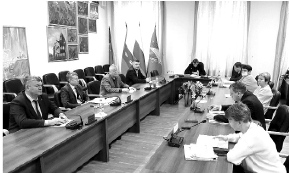
Заседание постоянной комиссии Тобольской гордумы по экономическому развитию, бюджету, налогам и финансам