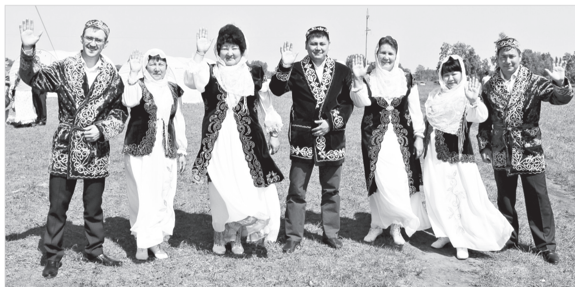
Яркий и колоритный коллектив «Достар» на Курултае в Голышманово.

Почти во всех певческих коллективах баритоны и теноры на вес золота. Мужчин этого ансамбля долго уговаривать не