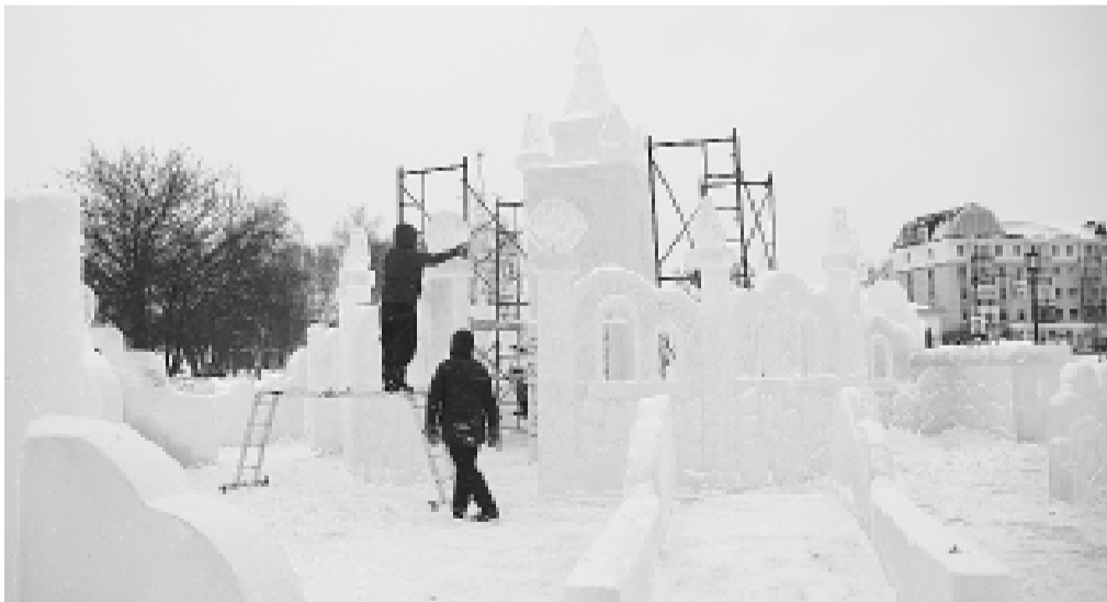
► До Нового года осталось всего ничего, и бригады работают не покладая рук.

В ледовом городке на Красной площади Тобольского кремля жизнь кипит