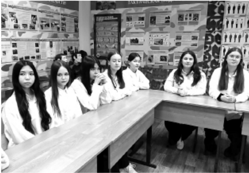
► Важный урок

«Конституция учит нас уважению к каждому человеку, его правам и свободам». «Она показывает, что каждый гражданин важен и имеет значение для своей страны». «Этот документ помогает понять, что важно жить не только для себя, но и быть полезным обществу, в котором мы