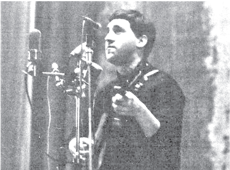
Владимир Высоцкий в клубе «Восток», январь 1967 г.