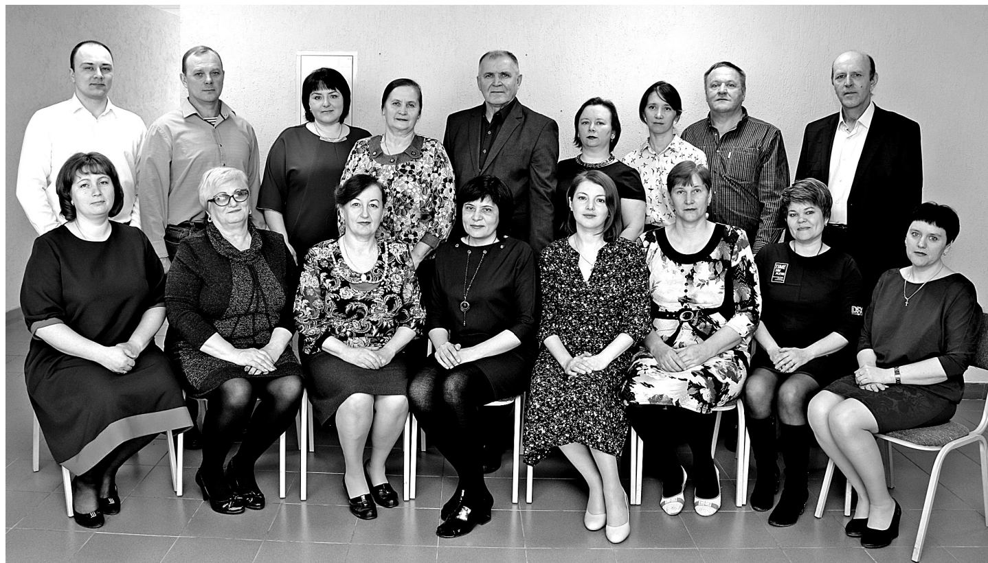
• Они контролируют, планируют, организуют, руководят. Каждый на своём участке и в своей сфере. И не обязательно за столом в кабинете. Поэтому зоотехников и ветврачей, главного энергетика и инженеров, прорабов и юриста, бухгалтеров и экономистов, секретаря и кадровиков для общей фотографии собрать было непросто.