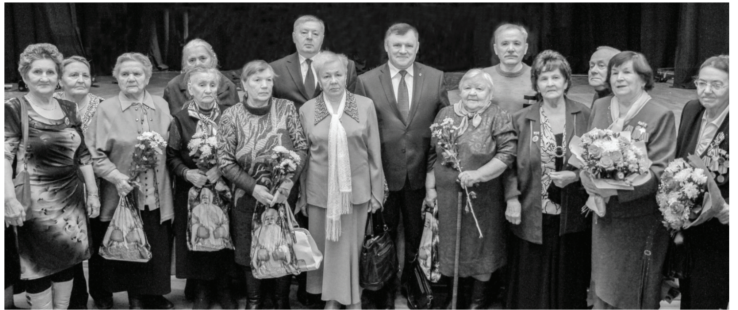
Участники встречи, посвящённой 75-летию полного освобождения Ленинграда от блокады.

Подготовили Марина СЕРГЕЕВА и Людмила МАРИКОВА.