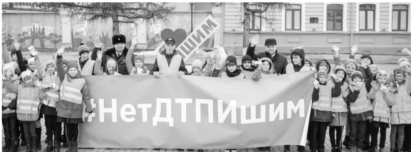
Школьники вышли на городские улицы, чтобы напомнить о необходимости соблюдения правил дорожного движения.

По городу вновь курсировал «шагающий автобус».