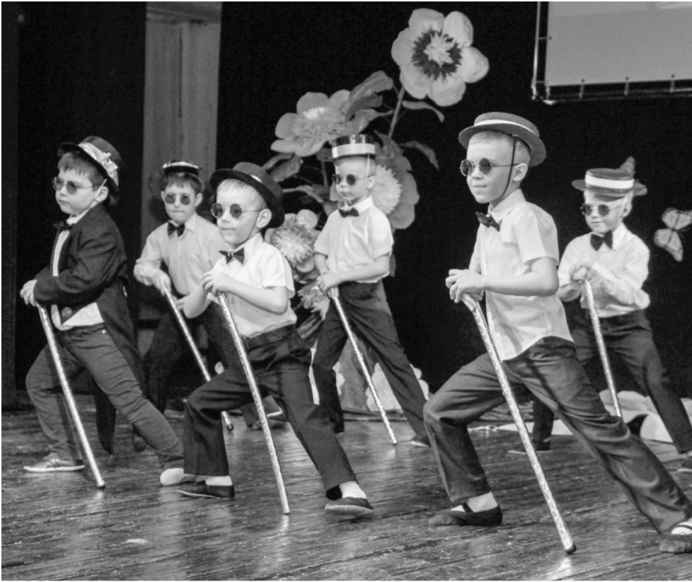
Сказка Андерсена «Дюймовочка» получила новую жизнь в современной музыке, песнях и танцах воспитанников детского сада № 19. Такими изысканными джентльменами перед зрителями предстала свита Крома.