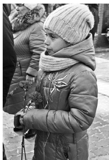
➤ Минута молчания.

О войне говорить тяжело, но забывать о ней мы не имеем права. Наша святая обязанность сохранять и передавать из поколения в поколение благодарность и память о мужестве и беззаветном служении