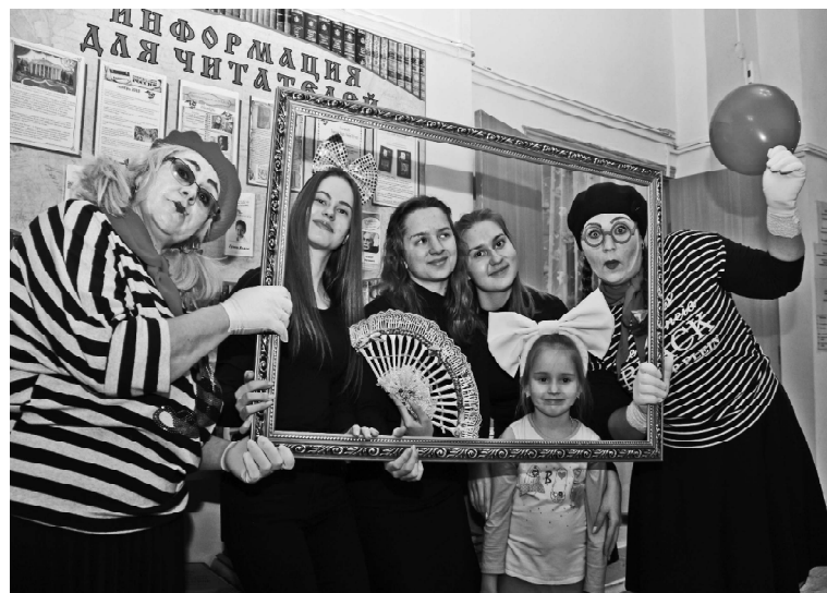
Мимы приглашают сделать фото на память.

Любители театральных игр выбрали «Библио-Перформанс «Театр+». Им предстояло посоревноваться в знании театральных тонкостей. Для это-