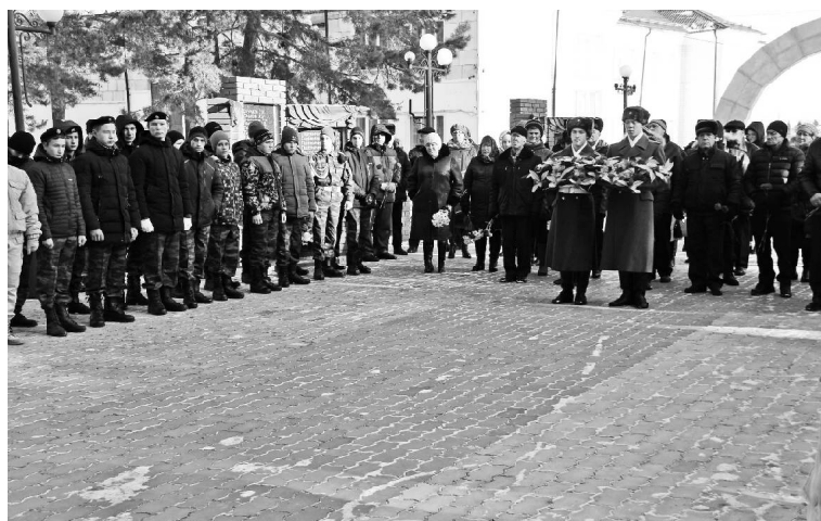
➤ Димитриевская суббота объединила викуловчан