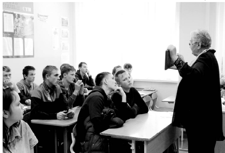
➤ На встрече со студентами техникума