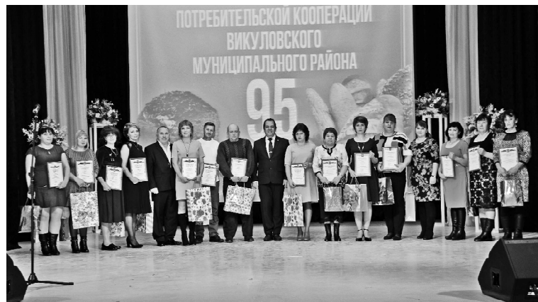
➤ Награждённые на сцене.