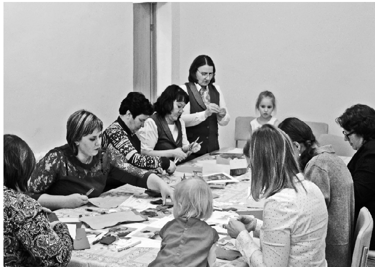
Арт-студия «Фетросказка»