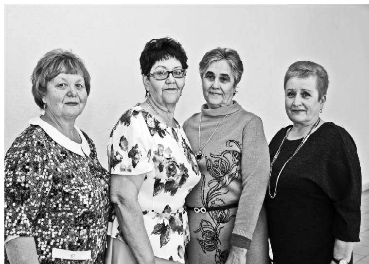
➤ Ветераны РайПО