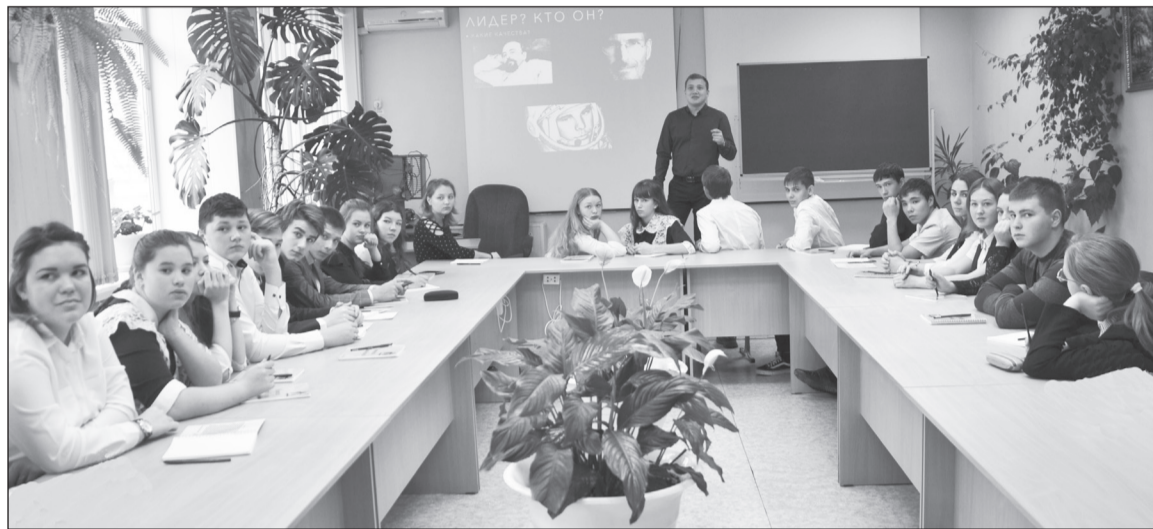
Проходит первый урок для будущих предпринимателей.