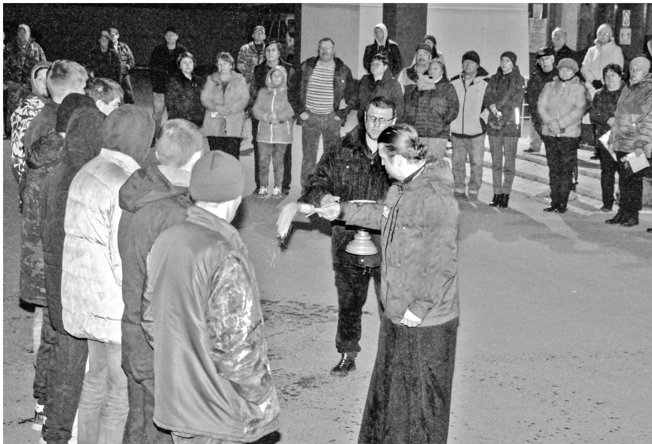
Сладковские призывники с боевым настроем отправились к месту несения военной службы.