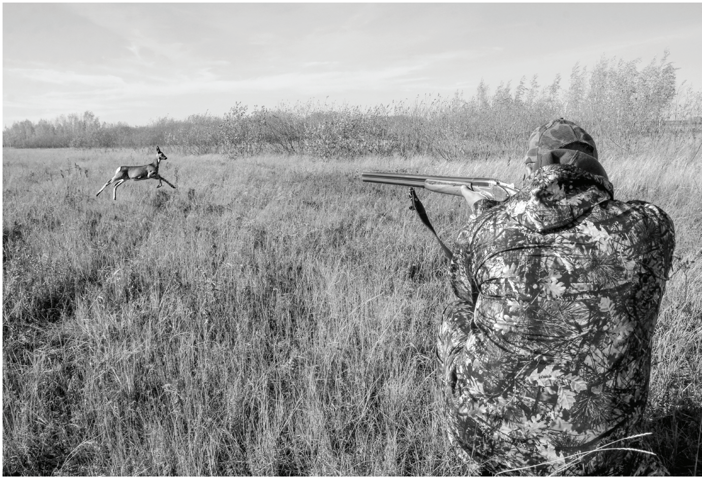
Сладковский район – «лакомый кусочек» Тюменской области для охотников.

Участникам же розыгрыша даётся право наблюдать за происходящими событиями и сходить с ума от адреналина.