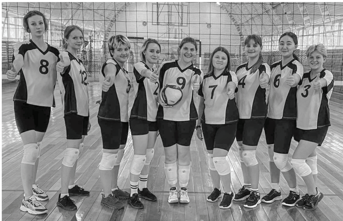
Сладковские спортсменки блистали мастерством.

9 октября завершились зональные игры XXVI спартакиады учащихся по волейболу в селе Казанском.