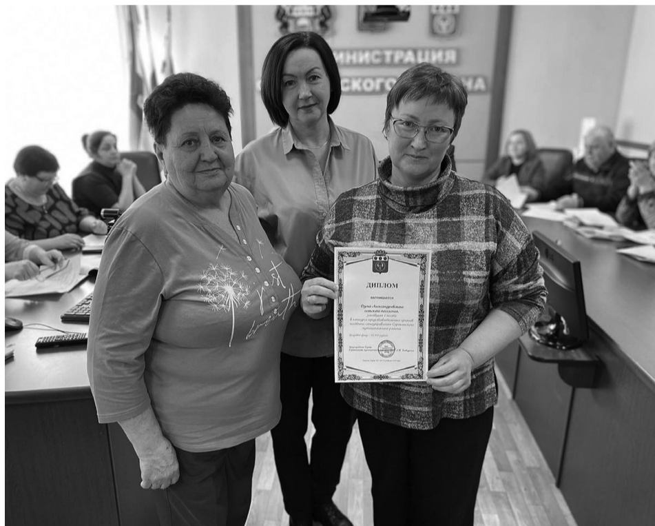
На снимке: победители конкурса получили награды

Документы, представленные Думой Александровского сельского поселения, будут направлены