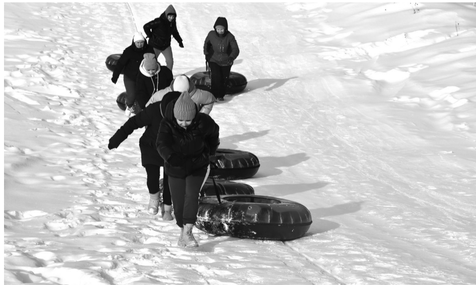
На снимке: с горы – легче, чем на гору

На свежем воздухе сорокинцы соревновались в хоккее на снегу, играли в волейбол на снегу, конечно же, в рамках праздника состоялся лыжный забег. Зрелищно прошёл массовый спуск с горы на тюбингах, интересно было наблюдать за «дворовым биатлоном», а также за различными дворовыми играми и зим-