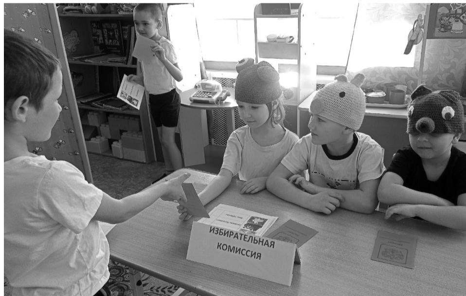
Дошколята знакомятся с избирательным правом