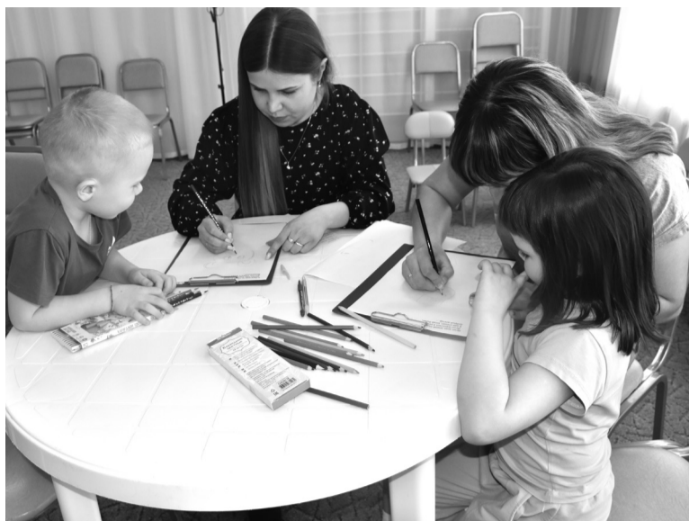
На снимке: фрагмент мероприятия

В ходе мероприятия родители на практике продемонстрировали прекрасное владение навыками выразительного чтения, прочитав предложенные отрывки из русских народных сказок. Мальчики и девочки внимательно слушали своих мам