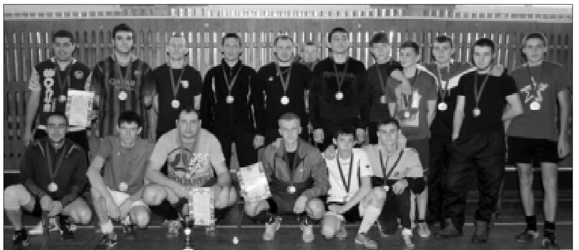
Команды райцентра - победители и призеры соревнования по мини-футболу

Первыми на лёд вышли юноши. Несмотря на морозную по-