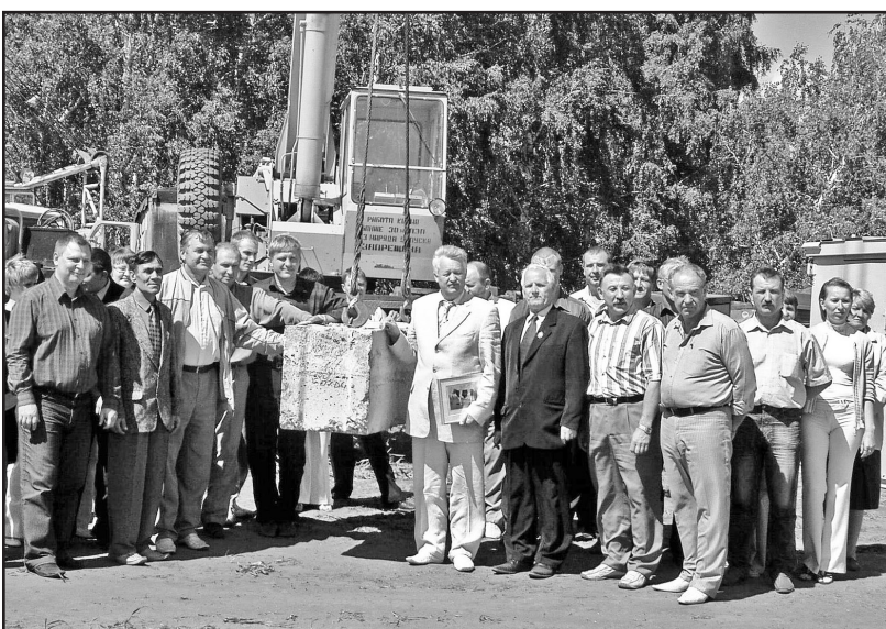
В день начала строительства мегафермы в Шагалово