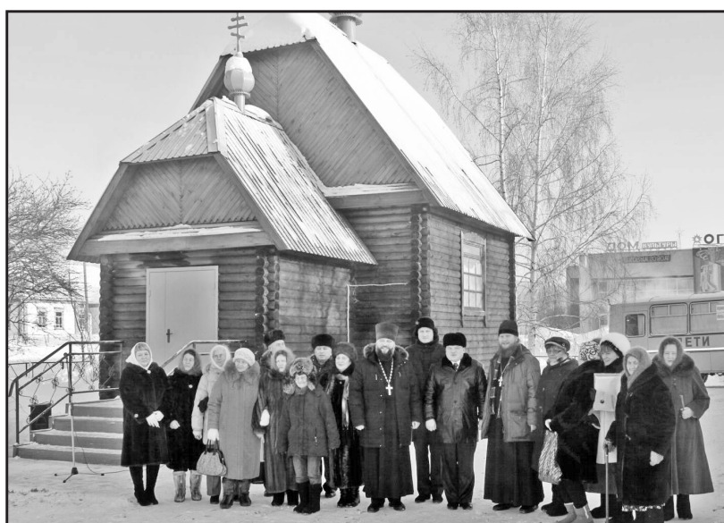
Открытие часовни в Огнёво. 2013 год

Руководство «Маяка» дорожит своими трудолюбивыми кадрами – теми, кто пашет землю, убивает хлеб, доит, принимает новорождённых телят, лечит животных, теми, кто умеет и любит работать.