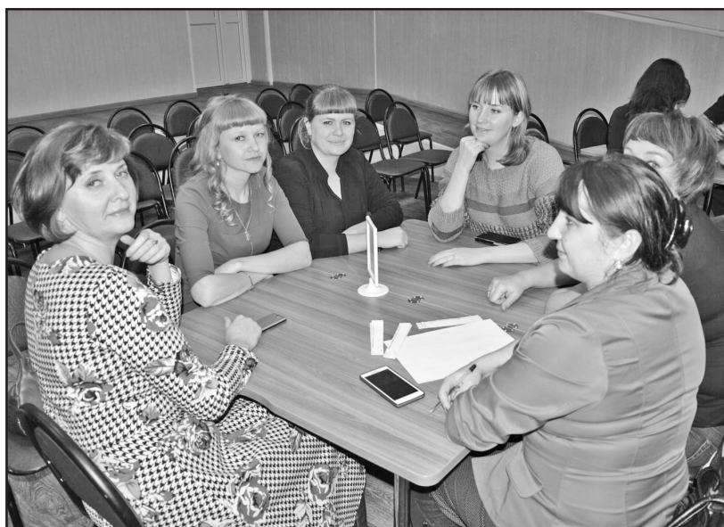
Победитель игры — команда районного социально-творческого объединения «Досуг»

Порой казалось, что действие происходит в студии, где снимают очередной сеанс одноимённой телеигры: знакомые музыкальные заставки из популярной телепередачи, чёрный ящик и игроки за круглыми столами, бурно обсуждающие выведенный на экран вопрос. На решение задания — ровно минута, и вот уже секунданты собирают записанные на листок ответы, чтобы предоставить их в счётную комиссию. Казалось бы, про советские фильмы уже все всё знают. Но вопросы ведущего были поставлены так, что знатокам предстояло не только отгадывать название того или иного фильма, героев или актёров, исполняющих роли, но