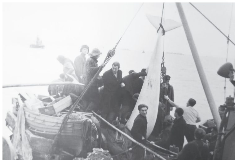
Моряки радуются хорошему улову.

Подготовила Людмила ИВЛЕВА.