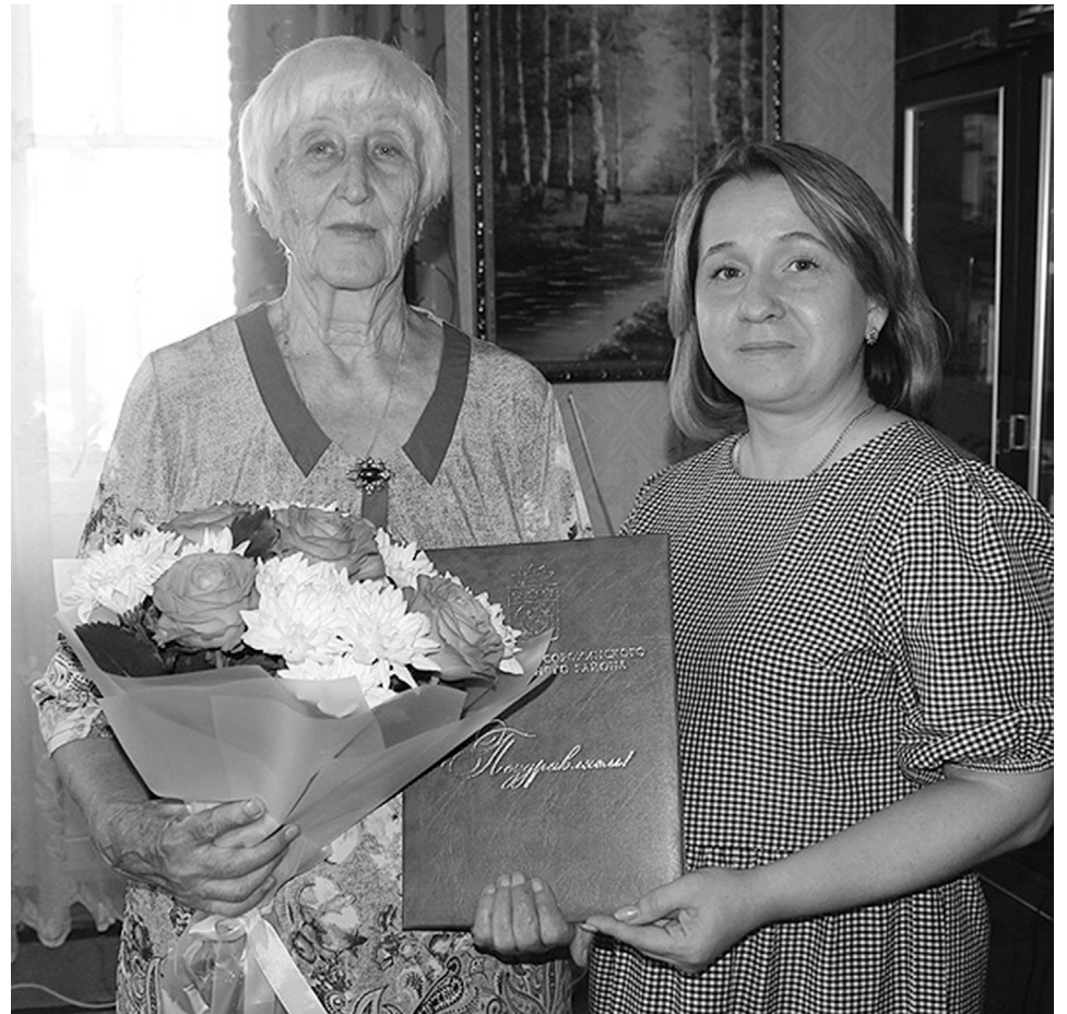
На снимке: именинница принимает поздравления

С 1976 года – заведующая кабинетом политпросвещения РК КПСС. В 1980 году назначена на должность заведующей общим отделом РК КПСС. Работала секретарём первичной парторганизации коммунистов РК КПСС и РК ВЛКСМ, секретарём комиссии по делам несовершеннолетних администрации района. Уже после выхода на пенсию руководила районным краеведческим музеем. Является большим другом редакции газеты "Знамя труда", где в течение нескольких лет была членом общественной приёмной редакции газеты, помогала решать насущные проблемы односельчан. Награждена грамотой