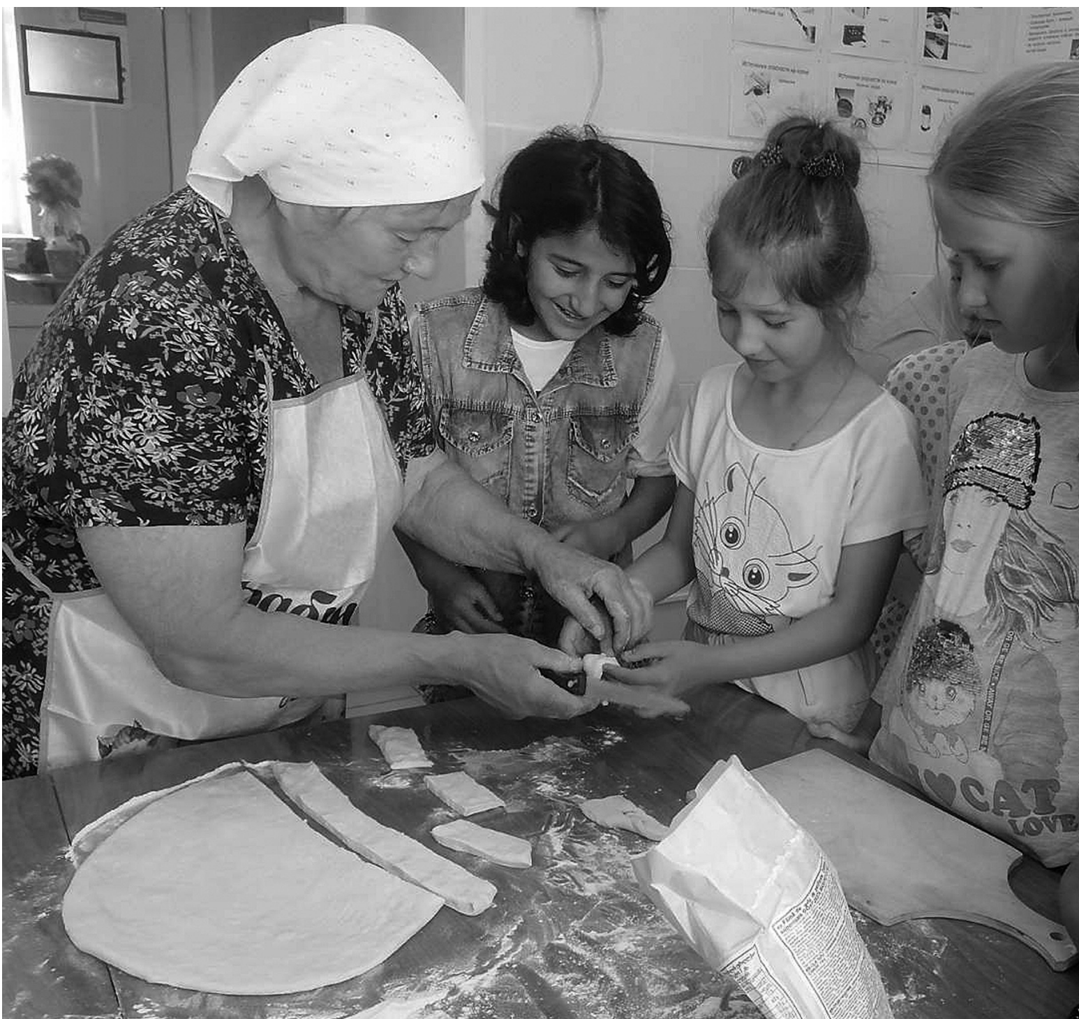
Девочки под руководством опытного наставника с удовольствием включились в работу