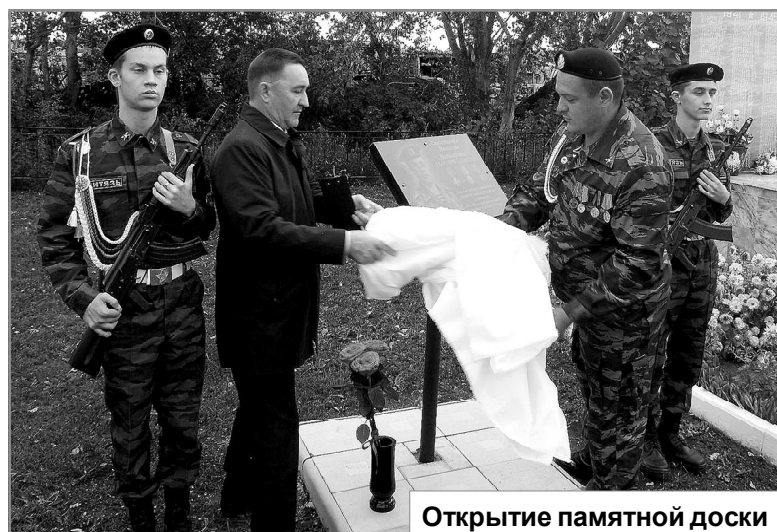
Открытие памятной доски