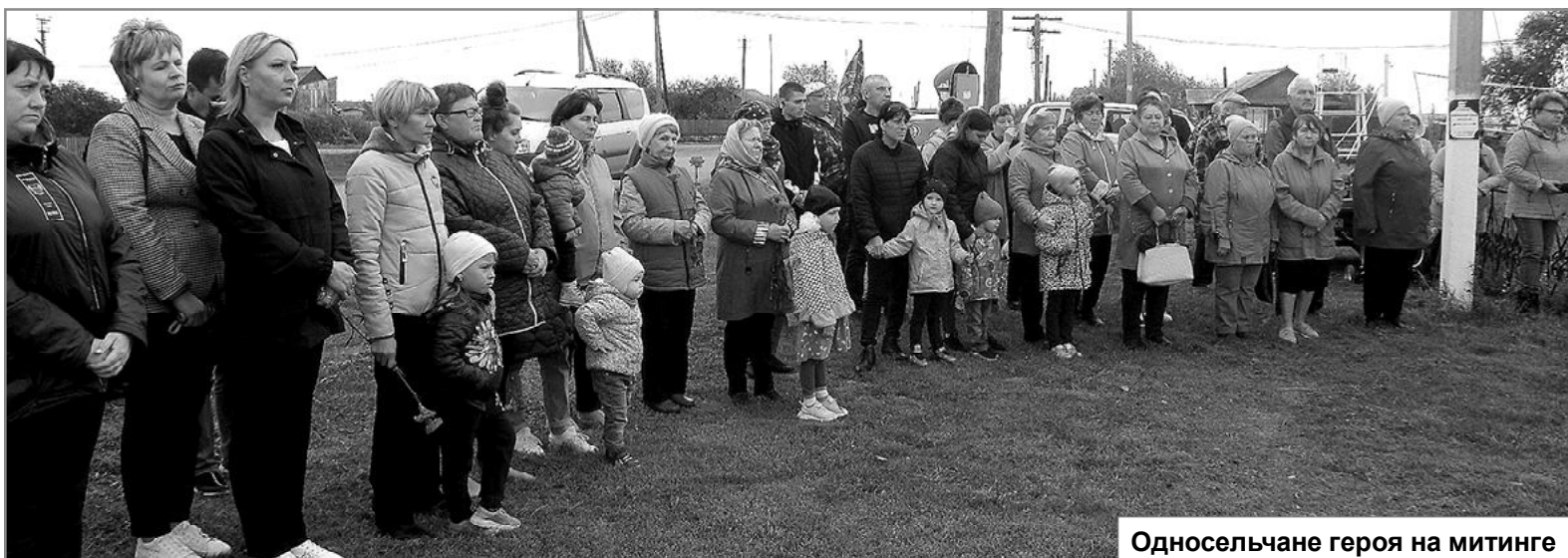
Односельчане героя на митинге