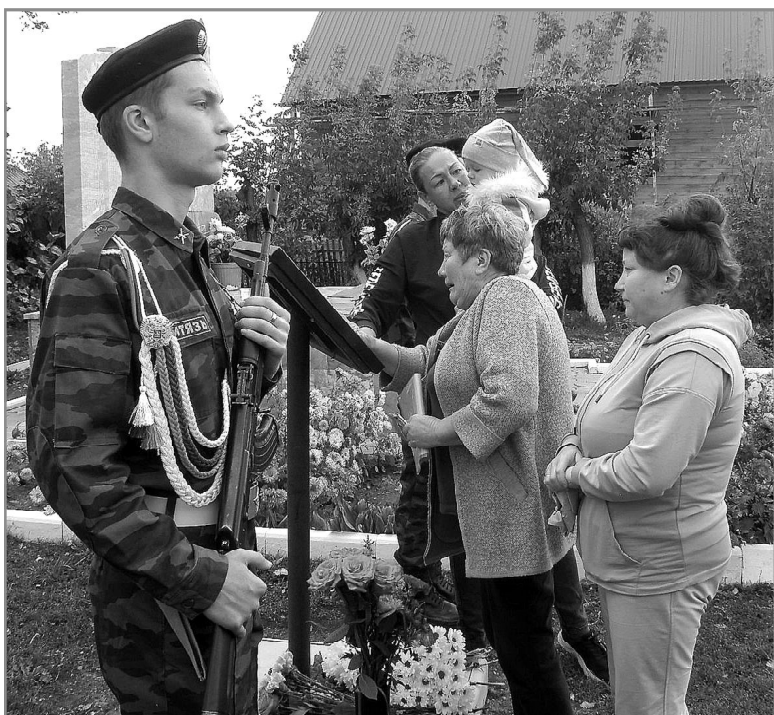
Боль от утраты близких не измерить ничем