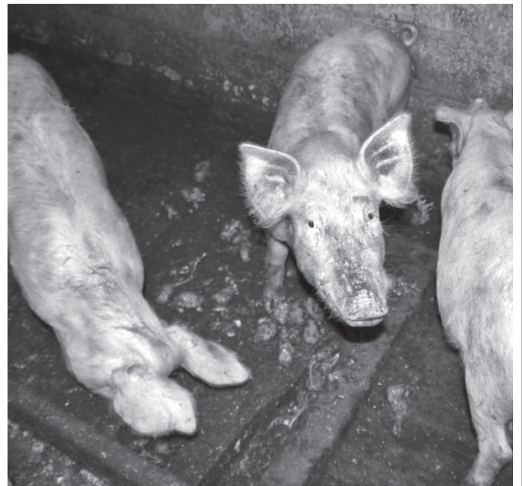
• Не выпускайте своё хрюкающее поголовье на вольные хлеба, дабы избежать контактов с другими животными.