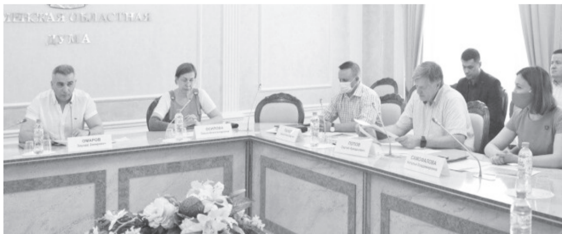
В областной думе решаются важные вопросы.