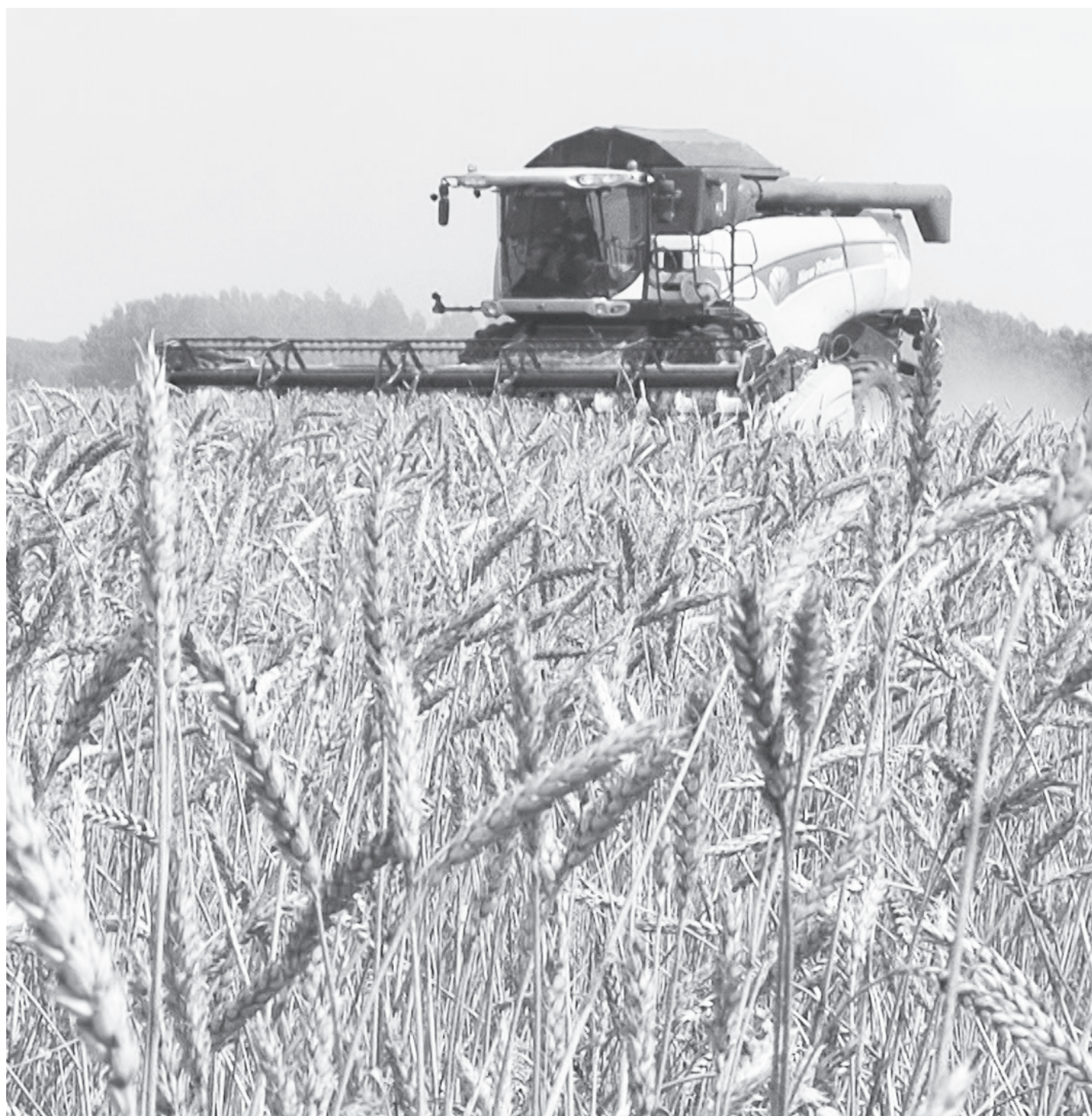
В агрофирме «КРиММ» озимые культуры убрали за неделю. Последнюю полоску сжали в Упоровском филиале.