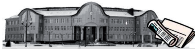
Администрация Уватского муниципального района